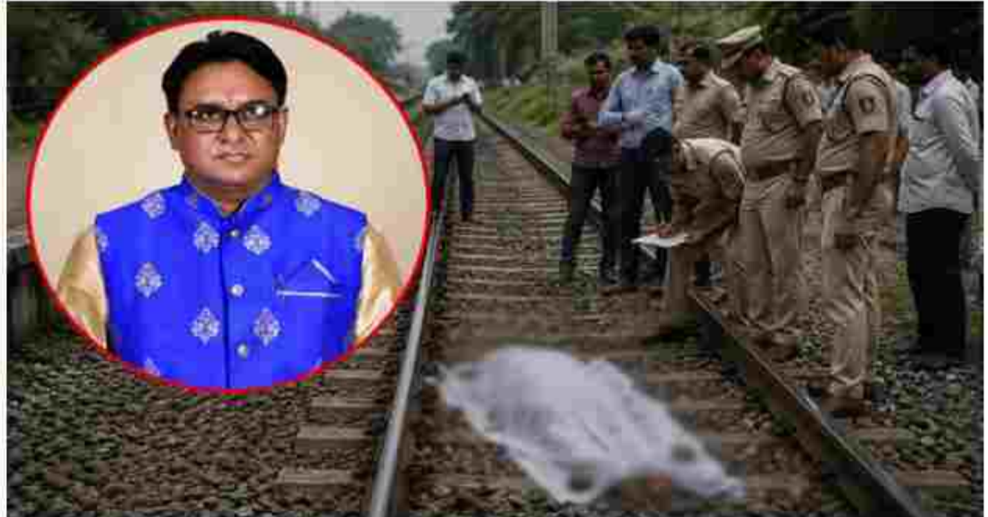
તાજેતરની ચૂંટણીમાં વોર્ડ નંબર-૧ માંથી બિનહારીક ચૂંટાયા હતા, પક્ષે સોંપી હતી 'લીડર' તરીકેની મહત્વની જવાબદારી.