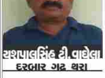
રણાલાલસિંઘ ટી. વાહેલા દરભાર ગઢ થરા

નારદજીને કહેવાયેલો આ પ્રસંગ ભક્તિ, શરણાગતિ અને ભગવાનની અહેતુકી કૃપાનો પરમ સંદેશ આપે છે. આ કથા માત્ર એક માસનો મહિમા નથી, પણ એ દરેક જીવનો મહિમા છે જેને જગત તિરસ્કૃત કરે, પણ જો તે પ્રભુને શરણે જાય તો પ્રભુ તેને પોતાના સમાન બનાવી દે છે. મળમાસનું દુઃખ અને વિષ્ણુને શરણે ગમન એકવાર નારદ મુનિ એ બદીનાથ નારાયણને પ્રશ્નકર્તા કે મળમાસ ના દુઃખનું વર્ણન કરી ને વિષ્ણુ ભગવાન મૌન કેમ થઈ ગયા? ત્યારે શ્રી નારાયણ બોલ્યા xહે નારદ, ગોલોકનાથ શ્રીકૃષ્ણ જે ગુહ્ય વચન શ્રી વિષ્ણુને કહ્યું હતું તે હું તેને કહું છું. દંભરહિત ઉત્તમ ભક્તને સર્વ કહેવું જોઈએ મળ માસ સ્વામી વિદીન હોવાથી અપાર દુઃખી હતો. તેની કોઈપણ કરતું નહીં, તેને અપવિત્ર ગણવા માં આવતો. દુઃખી થઈને તે વૈકુંઠ