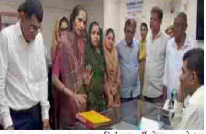
દિવસોમાં આ પ્રદૂષણ ફેલાવતી કેમિકલ ફેક્ટરીઓ અંધ કરવામાં નહીં આવે અથવા પ્રદૂષણ પર નિયંત્રણ નહીં મેળવાય, તો આ પ્રદર્શન ફેક્ટરીઓના તાળાબંધી સુધી પહોંચી શકે છે.

મહેસાણા શહેરમાં ચોમાસાની ઋતુ દરમિયાન ભારે પવન અને વરસાદને કારણે સર્જાતી ધુમ્કાનાઓ રોકવા માટે મહેસાણા મહાનગરપાલિકા દ્વારા લાલ આંખ કરવામાં આવી છે. શહેરના જાહેર માર્ગો અને ખાનગી મિલકતો પર લાગેલા જોખમી હોર્ડિંગ્સ મામલે તંત્રએ એજન્સીઓ સામે કડક કાર્યવાહીના સંકેત આપ્યા છે. શહેરમાં અનેક કોમ્પ્લેક્સની છત પર લોખંડના ઓંગલ અને ઈજલ સ્ટ્રક્ચર દ્વારા વિશાળ હોર્ડિંગ્સ ઉભા કરવામાં આવ્યા છે. વાવાઝોડા કે ભારે પવન વખતે આ સ્ટ્રક્ચર ધરાશયી થવાની અને જાન-માલનું મોટું નુકસાન થવાની ભીતિ છે. આથી જ, સુરક્ષાના ભાગરૂપે પ્રાથમિક ચકાસણી બાદ આ કડક આદેશો આપવામાં આવ્યા છે. ચોમાસાની ઋતુ નજીક આવતા જ સંભવિત હોનારતને ટાળવા માટે મહેસાણા