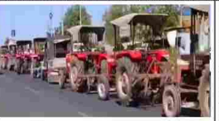
હાંતા તાલુકામાં ડીઝલની તીવ્ર અછત સર્જાઈ છે, જેના કારણે વાહનચાલકો અને ક્યોરી ઉદ્યોગને ભારે હાલાકીનો સામનો કરવો પડી રહ્યો છે. બેમાળ ગામના સત્યમ પેટ્રોલ પંપ પર ડીઝલ ટેકર બે ડિવસ મોટું પહોંચતા વાહનોની લાંબી કતારો લાગી ગઈ હતી.