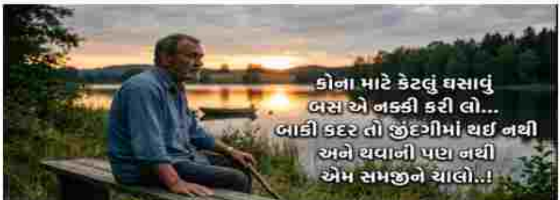
કોના માટે કેટલું ઘસાવું બસ એ નક્કી કરી લો...

સમય વીત્યો. ગૌરી લગ્નયોગ્ય થઈ. ગામમાં વાત ફેલાઈ, પણ 'અનાથ' છોકરી સાથે લગ્ન કરવા કોણ તૈયાર થાય? કન્યાદાન જેવી પવિત્ર વિધિ પિતા વિના કેમ પુરી થાય? સમાજના સલાહો ગૌરીના કલ્પને લીધી નાખતા હતા. આવા સમયે જયપુરનો એક નેકરિલ યુવાન, અર્જુન, ગૌરીના શીલ અને શ્રદ્ધાથી પ્રભાવિત થઈ તેની સાથે લગ્ન કરવા તૈયાર થયો. ગોઠવાયેલા લગ્ન નક્કી થયા, પણ ગામના સંકુચિત લોકોના ટોણા ચાલુ જ રહ્યા. 'કન્યાદાન કોણ કરશે?' શું ભૂત પ્રેત આવશે? લગ્નની આગલી રાત, આખું ગામ ઊંધું હતું. પણ ગૌરીની આંખોમાંથી આંસુ વહી રહ્યાં હતાં. તે કોનીને ખાતું સ્થામના મંદિરે પહોંચી અને મૂર્તિને વળગીને કૂચકે કૂચકે રહી પડી. 'ખાબા, મેં જિંદગીભર તમને જ બાપ માન્યાં. કાલે દુનિયા સામે હું કરી અનાથ સાબિત થઈશ? શું મારા પિતાનું સ્થાન ખાલી જ રહેશે?' તેનો કલ્પ પોકાર મંદિરની ડીવાલો સાથે