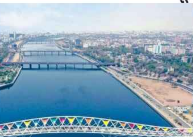
નહીં, પણ લકઝુરિયસ લાઈફ સ્ટાઈલ માટે શહેરની પહેલી ફરજિયાત છે. ડેવલપર્સે હવે પસંદ બની રહી છે. આધુનિક સુવિધાઓ અને પાર્કિંગની ઉત્તમ વ્યવસ્થાને કારણે હવે લોકો જૂના વિસ્તારો છોડીને આ હાઈ-રાઈઝ પ્રોજેક્ટ્સ તરફ વળ્યા છે.

શહેર હવે માત્ર હેરિટેજ તરીકે જ નહીં, પણ આધુનિક મેગાસિટી તરીકે પોતાની નવી ઓળખ બનાવી રહ્યું છે. એક જમાનામાં લાહદરવાજાનું ૧૨ માળનું બહુમાળી ભવન શહેરની સૌથી ઊંચી ઓળખ ગણાતું હતું. જે શહેરની ગલીઓમાં દસ માળનું બિલ્ડિંગ જોઈને આશ્ચર્ય થતું હતું, તે જ અમદાવાદમાં હવે આકાશને આંબતી ઈમારતોનું નવું પ્રકરણ શરૂ થયું છે. છેલ્લા ત્રણ વર્ષમાં શહેરના વિકાસ એટલી ઝડપે વધ્યો છે તે જોતાં આગામી દાયકામાં શહેરનો નજારો મુંબઈ કે દુબઈ જેવો ભવ્ય જોવા મળશે.