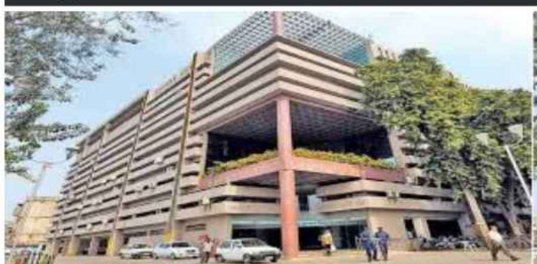
કામગીરી કરી શકાય. સરકારના ઉચ્ચ સ્તરે સ્પષ્ટ સૂચના આપવામાં આવી છે કે નાગરિકોની સુરક્ષા સર્વોચ્ચ પ્રાથમિકતા છે અને તમામ મનપા કમિશનરોને ૧૫ જૂન સુધીમાં સફાઈ તેમજ સુરક્ષા સંબંધિત કામગીરી ૧૦૦ ટકા પૂર્ણ કરવા માટે કહેવામાં આવ્યું છે.