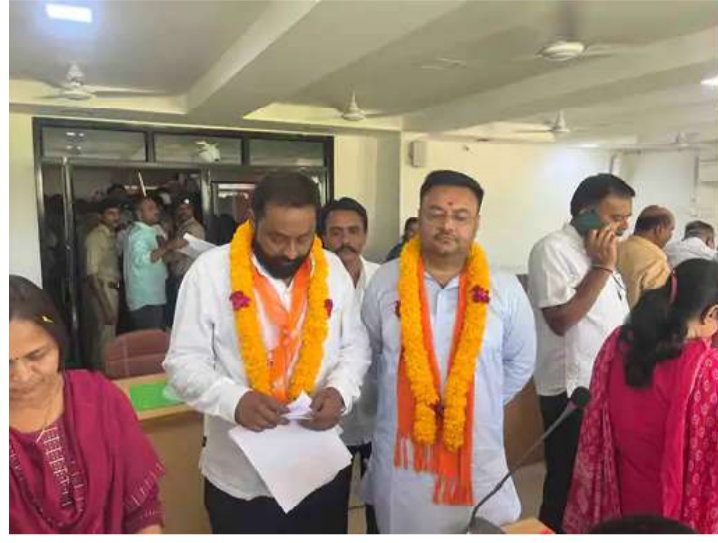
(ગરવી તાકાત) પાલનપુર તા. ૧૧ બનાસકાંઠા જિલ્લામાં સ્થાનિક સ્વરાજ્યની ચૂંટણીનો જંગ હવે તેજ બન્યો છે. ઉમેદવારી ફોર્મ ભરવાના અંતિમ દિવસે પણ ભાજપ અને કોંગ્રેસ દ્વારા ઉમેદવારોની સત્તાવાર

યાદી જાહેર ન કરવામાં આવતા રાજકીય વર્તુળોમાં ભારે સસ્પેન્સ સર્જાયો હતો. બંને પક્ષોએ વ્યૂહાત્મક રીતે યાદી ગુપ્ત રાખી ઉમેદવારો પાસેથી ફોર્મ ભરાવ્યા હોવાથી અંતિમ ક્ષણ સુધી ઉમેદવારોમાં અસમંજસની