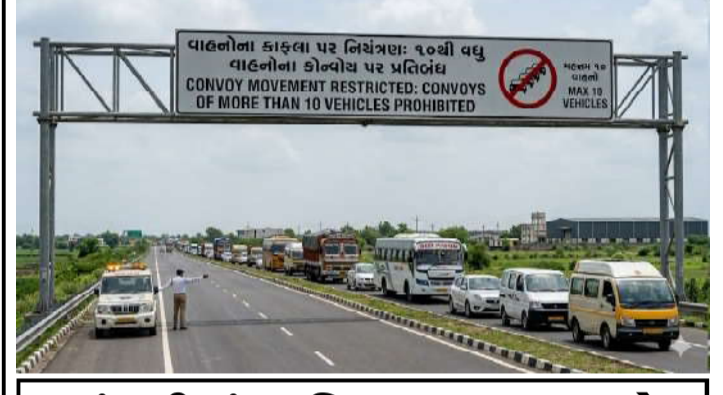
ચૂંટણીમાં ટ્રાફિક વ્યવસ્થા માટે કડક પગલાં