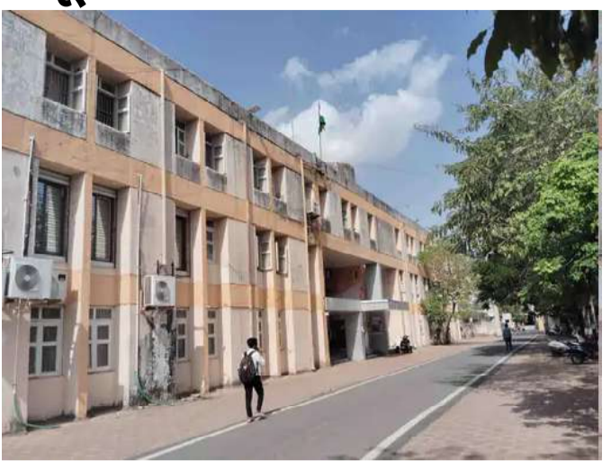
(ગરવી તાકાત) પાલનપુર તા.૮

બનાસકાંઠામાં ચૂંટણી ૨૦૨૬ માટે કંટ્રોલ રૂમ શરૂ જિલ્લા-તાલુકા પંચાયતની સામાન્ય ચૂંટણી માટે હેલ્પલાઇન જાહેર