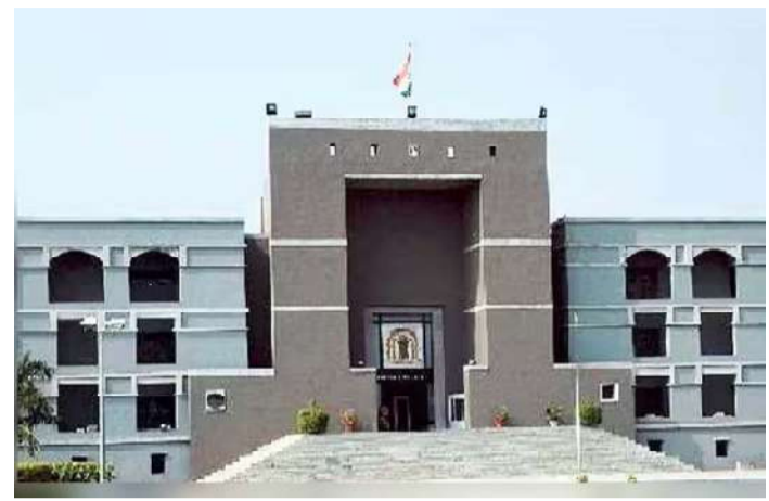
આવી હતી. તપાસ દરમિયાન આ પણ બહાર આવ્યું હતું કે ડોક્ટર જાતિ પરીક્ષણ સિવાય મહિલાઓના ગર્ભપાત પણ

કર્ચું કે પીસી એન્ડ પીએનડીટી એક્ટ હેઠળની જોગવાઈઓ પોલીસને ભારતીય દંડ સંહિતા હેઠળ તપાસ કરવા અથવા ચાર્જશીટ દાખલ કરવા માટે અટકાવતી નથી. આ કેસની શરૂઆત વર્ષ ૨૦૧૨માં વિસનગરના તત્કાલીન જિલ્લા કલેક્ટર અને સબ-ડિવિઝનલ મેજિસ્ટ્રેટ દ્વારા હાથ ધરાયેલા સ્ટેંગ ઓપરેશનથી થઈ હતી. આ ઓપરેશન દરમિયાન ડોક્ટર તેમના ખાનગી મેટરનિટી હોમમાં સોનોગ્રાફી દ્વારા ગર્ભની જાતિનું ગેરકાયદેસર પરીક્ષણ કરતા હોવાની વિગતો સામે