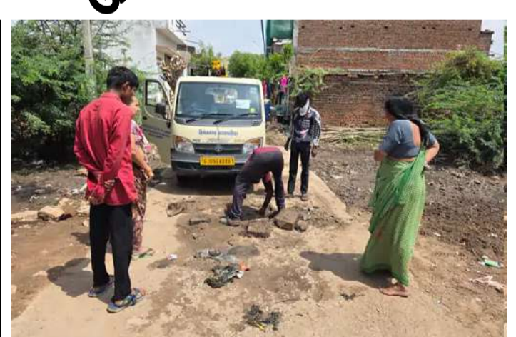
જવાની ફરજ પડી હતી.

(ગરવી તાકાત) હિંમતનગર તા.૮ સાબરકાંઠા જિલ્લાના હિંમતનગરના ભોલેશ્વર વિસ્તારમાં છેલ્લા બે દિવસથી ગટર ઉભરાઈ રહી હતી. ખાડિયા વિસ્તારની સોસાયટીઓમાં ગટરના પાણી ભરાઈ જતાં સ્થાનિકોને ભારે હાલાકીનો સામનો કરવો પડ્યો હતો. રોડ પર પાણી ભરાવાને કારણે ચાલીને જવું મુશ્કેલ બન્યું હતું અને લોકોને ફરીને