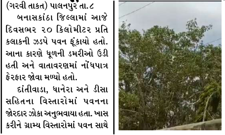
જનજીવન પ્રભાવિત થયું.

(ગરવી તાકાત) પાલનપુર તા.૮ બનાસકાંઠા જિલ્લામાં આજે દિવસભર ૨૦ કિલોમીટર પ્રતિ કલાકની ઝડપે પવન ફૂંકાયો હતો. આના કારણે ધૂળની ડમરીઓ ઉડી હતી અને વાતાવરણમાં નોંધપાત્ર ફેરફાર જોવા મળ્યો હતો. દાંતીવાડા, ધાનેરા અને ડીસા સહિતના વિસ્તારોમાં પવનના જોરદાર ઝોક અનુભવાયા હતા. ખાસ કરીને ગ્રામ્ય વિસ્તારોમાં પવન સાથે