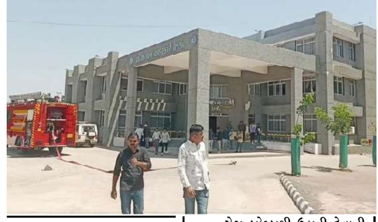
RTO કચેરીમાં ૧૨:૫૦ સુધીમાં ગેસ બોમ્બ વિસ્ફોટ થશે ધમકીભર્યો ઇમેઇલ મળ્યો

એસઓજી, કાઇમ ડ્રાન્ચ, ડોગ સ્કોડ, બોમ્બ સ્કોડ, ક્યુઆરટીની ટીમોએ આખું કેમ્પસ ખાલી કરાવી ચેકીંગ હાથ ધર્યું, શંકાસ્પદ ન મળતાં તંત્રએ રાહતનો શ્વાસ લીધો