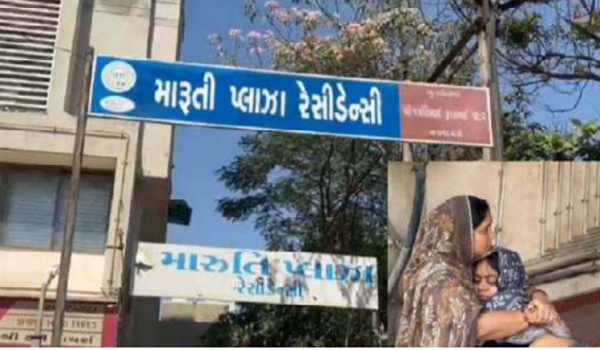
આરોગ્યા હતા. ભોજન કર્યાના થોડા જ સમયમાં પરિવારના તમામ સભ્યોની તબિયત લથડવા લાગી હતી.

મળતી માહિતી મુજબ, બે દિવસ અગાઉ ચાંદખેડામાં રહેતા એક પરિવારે બહારથી ટોસા બનાવવા માટે ખીર મંગાવ્યું હતું. પરિવારના સભ્યોએ રાત્રે ઘરે આ ટોસા બનાવીને