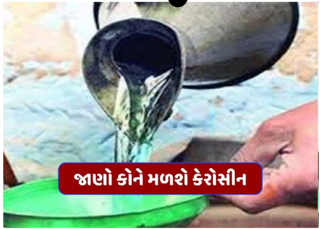
જાણો કોને મળશે કેરોસીન

વિતરણના નિયમો અને જથ્થો આ યોજના હેઠળ કેરોસીન મેળવવા માટે નીચે મુજબના માપદંડો નક્કી કરવામાં આવ્યા છે: પરિવાર દીઠ ફાળવણી: દરેક પરિવારને ૫ લિટર કેરોસીન આપવામાં આવશે. ઓછામાં ઓછા ૧૨,૦૦૦ લિટરની ઓનલાઇન માંગણી પ્રાપ્ત થતાં જ તાત્કાલિક સપ્લાય ઉપલબ્ધ કરાવવામાં આવશે. ભાવ બાબતે ટ્રાન્સપોર્ટ તથા અન્ય ખર્ચને ધ્યાનમાં રાખીને પ્રતિ લિટર રૂ. ૬૧.૪૦ થી ૬૬.૧૪ સુધીનો દર નક્કી કરવામાં આવ્યો છે. રાજ્ય સરકારના આ નિર્ણયથી ગ્રામ્ય વિસ્તારોમાં ગેસની અછત વચ્ચે લોકોને રાહત મળશે તેવી અપેક્ષા છે.