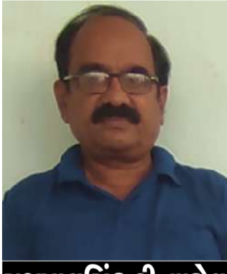
રશપાલસિંહ ટી. વાહેલા દરબાર ગટ થરા

અને અન્યાય સામે અડગ રહેતો. X સમય પસાર થતો ગયો, અને એક દિવસ, સંજોગોએ વળાંક લીધો. આંધળો માણસને તેની દૈષ્ટિ પાછી મળી, લંગડા માણસ ના પગ સાજા થયા, ગરીબ માણસ સખત મહેનતથી ધનવાન બન્યો, મૂર્ખ માણસ વિદ્વાન બન્યો, અને નબળો માણસ અતિશય મજબૂત બન્યો જો કે, તેમની ઈચ્છાઓ પૂર્ણ થતાં જ, તેમના વર્તનમાં પણ પરિવર્તન આવ્યું. આંધળો માણસ હવે દૈષ્ટિથી સંપન્ન સુંદર વસ્તુઓ જોવામાં દિવસો અને રાત વિતાવવા લાગ્યો... પોતાની અંદર ખોવાઈ ગયો. તેણે બીજાઓના દુઃખનો કોઈ વિચાર કર્યો નહીં. લંગડો માણસ, જે હવે ચાલવા અને ફરવા માટે સક્ષમ હતો, તે સ્વાર્થીથી ભરાઈ ગયો અને સંપત્તિ ભેગી કરવાની દોડમાં ડૂબી ગયો. ગરીબ માણસ, જે હવે ધનવાન બની ગયો હતો, તેણે જાહેર કાર્ય, Xમાં આ સંપત્તિ મારીપોતાની મહેનતથી મેળવી છે હું તે બીજા કોઈને કેમ આપું? તેણે ગરીબોને મદદ કરવાનું બંધ કરી દીધું. તેવી જ રીતે, વિદ્વાન વ્યક્તિએ