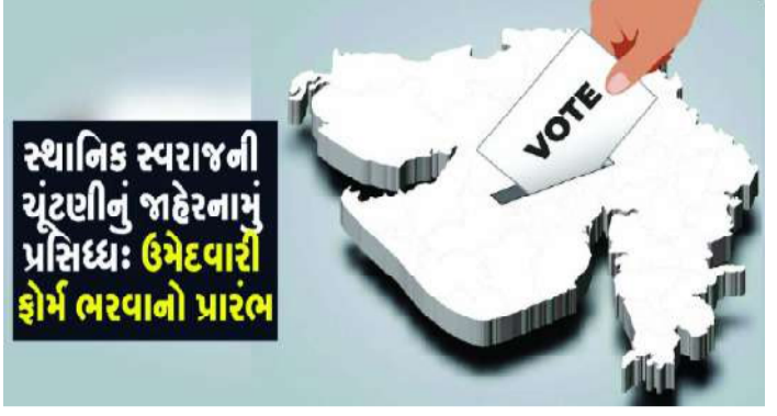
સ્થાનિક સ્વરાજની ચૂંટણીનું જાહેરનામું પ્રસિધ્ધ : ઉમેદવારી ફોર્મ ભરવાનો પ્રારંભ

સ્થાનિક સ્વરાજની આ ચૂંટણીનું જાહેરનામું આજે પ્રસિધ્ધ થતા જ ઉમેદવારો તા. ૧૧ એપ્રિલ સુધી નામાંકન પત્રો ચૂંટણી અધિકારી સમક્ષ સબમીટ કરાવી શકશે. જયારે