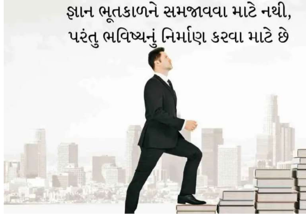
જ્ઞાન ભૂતકાળને સમજાવવા માટે નથી, પરંતુ ભવિષ્યનું નિર્માણ કરવા માટે છે

અને અન્યાય સામે અડગ રહેતો. X સમય પસાર થતો ગયો, અને એક દિવસ, સંજોગોએ વળાંક લીધો. આંધળો માણસને તેની દૈષ્ટિ પાછી મળી, લંગડા માણસ ના પગ સાજા થયા, ગરીબ માણસ સખત મહેનતથી ધનવાન બન્યો, મૂર્ખ માણસ વિદ્વાન બન્યો, અને નબળો માણસ અતિશય મજબૂત બન્યો જો કે, તેમની ઈચ્છાઓ પૂર્ણ થતાં જ, તેમના વર્તનમાં પણ પરિવર્તન આવ્યું. આંધળો માણસ હવે દૈષ્ટિથી સંપન્ન સુંદર વસ્તુઓ જોવામાં દિવસો અને રાત વિતાવવા લાગ્યો... પોતાની અંદર ખોવાઈ ગયો. તેણે બીજાઓના દુઃખનો કોઈ વિચાર કર્યો નહીં. લંગડો માણસ, જે હવે ચાલવા અને ફરવા માટે સક્ષમ હતો, તે સ્વાર્થીથી ભરાઈ ગયો અને સંપત્તિ ભેગી કરવાની દોડમાં ડૂબી ગયો. ગરીબ માણસ, જે હવે ધનવાન બની ગયો હતો, તેણે જાહેર કાર્ય, Xમાં આ સંપત્તિ મારીપોતાની મહેનતથી મેળવી છે હું તે બીજા કોઈને કેમ આપું? તેણે ગરીબોને મદદ કરવાનું બંધ કરી દીધું. તેવી જ રીતે, વિદ્વાન વ્યક્તિએ