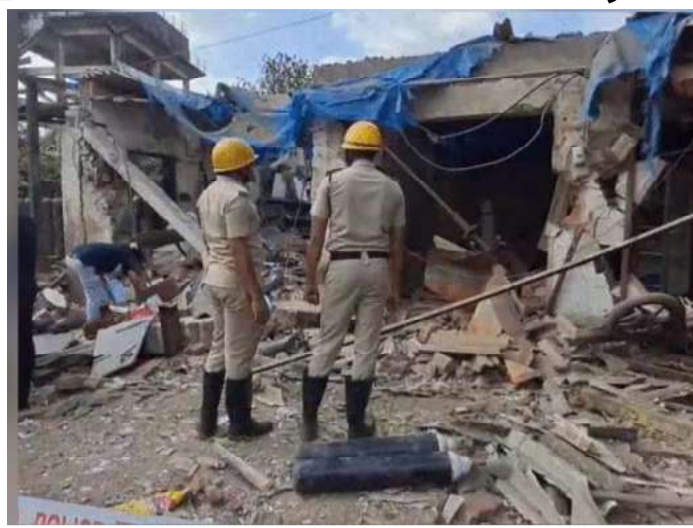
૪ શ્રમિકોના લોહીલુહાણ હાલતમાં ઘટનાસ્થળે જ કચ્છ મોત નીપજ્યા હતા.

સેલવાસ,તા.૪ સંઘપ્રદેશ દાદરા અને નગર હવેલીના હૃદય સમાન સેલવાસના કેમ વિસ્તારની નજીકમાં આવેલ નાઇટ્રોજન ગેસના એક ગોડાઉનમાં મધરાતે પ્રચંડ વિસ્ફોટ થતા સમગ્ર પંથક ધ્રુજ ઉઠ્યો હતો. આ દુર્ઘટનાએ ઉદ્યોગ જગત અને સ્થાનિકોમાં ભારે ખળભળાટ મચાવી દીધો છે.