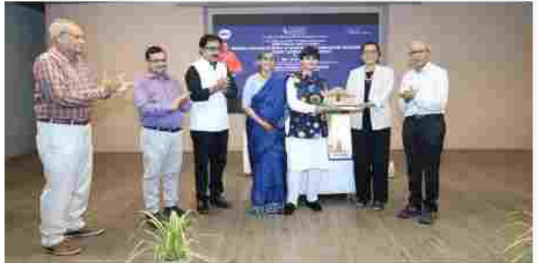
(ગરવી તાકાત) અમદાવાદ તા. ૩૧