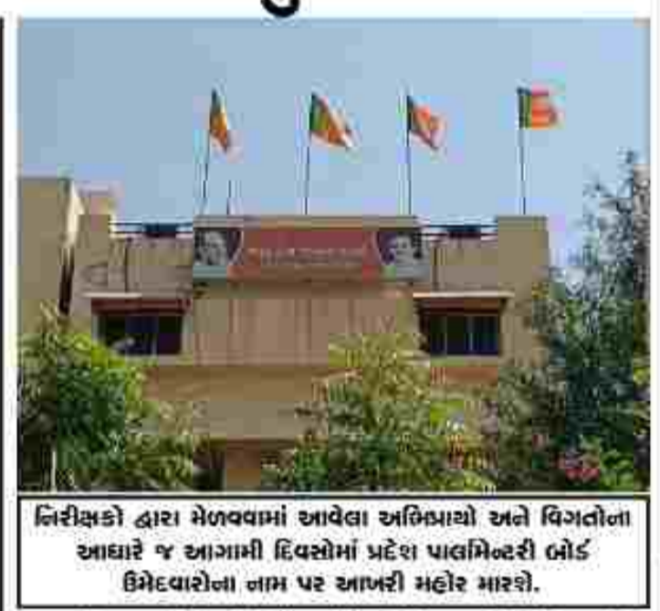
નિરીક્ષકો દ્વારા મેળવવામાં આવેલા અભિપ્રાયો અને વિગતોના આધારે જ આગામી દિવસોમાં પ્રદેશ પાલમેન્ટરી ઓફ ઉમેદવારોના નામ પર આખરી મહોર મારશે.

(ગરવી તાકાત) પાટણ તા. ૩૧ પાટણ જિલ્લામાં આગામી સ્થાનિક સ્વરાજની ચૂંટણી માટે રાજકીય ગરમાવો તેજ બન્યો છે. ભારતીય જનતા પાર્ટી (BJP) દ્વારા ઉમેદવારોની પસંદગી માટે પ્રદેશ નિરીક્ષકોની બે ટીમો ૨ અને ૩ એપ્રિલે જિલ્લાની મુલાકાત લેશે. આ ટીમોમાં ગ્રહ-ગણ સભ્યોનો સમાવેશ થાય છે. તેમનો મુખ્ય ઉદ્દેશ્ય પાટણ જિલ્લાની ૯ તાલુકા પંચાયત, ૧ જિલ્લા પંચાયત અને ૨ નગરપાલિકાઓ માટે સક્રમ ઉમેદવારોની પસંદગી કરવાનો છે. આ પ્રક્રિયા દ્વારા પક્ષના કાર્યકરોનો મિજાજ પારખીને શ્રેષ્ઠ પ્રિય સહારાઓને તક આપવા માટે 'સેન્સ' લેવામાં આવશે. નિરીક્ષકોની પ્રથમ ટીમ ૨ એપ્રિલે સવારે ૧૦ વાગ્યાથી પાટણ જિલ્લા ભાજપ કાર્યાલય ખાતે ઉપસ્થિત રહેશે. અહીં પાટણ, સરસ્વતી અને સિદ્ધપુર તાલુકાના દાવેદારોની રજૂઆતો સાંભળવામાં આવશે. ત્યારબાદ, ૩ એપ્રિલે આ જ ટીમ દ્વારા પાટણ અને સિદ્ધપુર નગરપાલિકા માટે સેન્સ પ્રક્રિયા હાથ ધરવામાં આવશે.