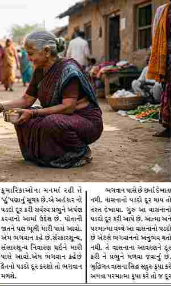
અનેકમાં તેમની આસક્તિ હોય છે. એમના પરિવારનો પાર નથી.

યાવરણને દૂર કરી ને પ્રભુને મળવા જવાનું છે. બુદ્ધિગત વાસના સિદ્ધ સદુક કૃપા કરે અથવા પરમાત્મા કૃપા કરે તો જ દૂર થાય છે. તમે એવા નિર્મળ થશો, સર્વ પ્રકારે શુદ્ધ થશો તો તમે ઈશ્વર સાથે રમી રમશો, ત્યારે જીવન ઈશ્વર સાથે મિલન થશે ત્યારે રાસ થશે. તે પહેલાં પુતનાવધ-અવિદ્યાનો નાશ થવો જોઈએ. અવિદ્યાનો નાશ થાય, એટલે સંસારનું ગાડું સુધરે છે. એ ખતાવવા શકતાંસુર નો વધ કર્યો. સંસારનું ગાડું સુધર્યું એટલે તુલાવર્તન મળ્યું. તુલાવર્તન એટલે કે રજોગુણનો નાશ થયો. રજોગુણ મળ્યું એટલે માખણ ચોરીની લીલા આવી. શ્રીકૃષ્ણે મનની ચોરી કરી, એટલે જીવન સાત્વિક બન્યું. વાચક શાહક મિત્રા સૌને જય માતાજી સુપ્રભાત, જીવન ખૂબ દૃઢું છે; દરરોજ સવારે દુઃખ, જાણીને તેને પસ્તાવાના ભારથી જાગીને તેને બગાડો નહીં. જેઓ તમારી સાથે સારો વ્યવહાર કરે છે તેમને પ્રેમ કરો, અને જેઓ નથી કરતા તેમના માટે કરુણા અને સહાનુભૂતિ રાખો. જેમ કોઈએ એક વખત યોગ્ય રીતે કહ્યું હતું: *જેઓ મને પસંદ નથી કરતા તેમને નફરત કરવા માટે મારી પાસે સમય નથી. *અસ આજે આપણે અહીં અટકીએ અમ્મ.