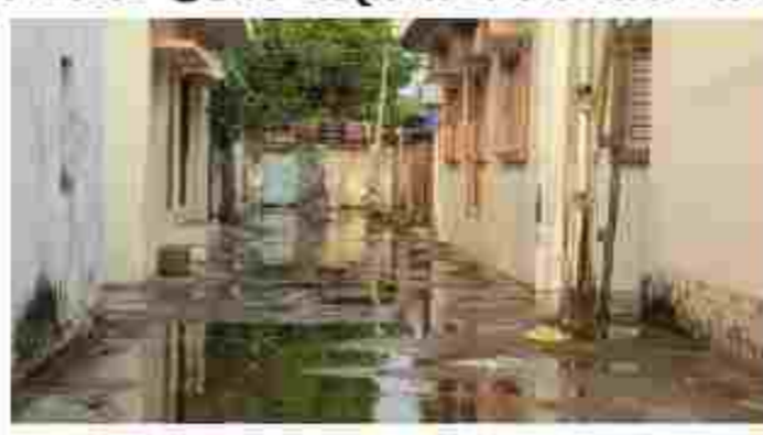
અહેવાલો મળ્યા છે, જેના કારણે ખેડૂતો ચિંતા મુક્યા હતા.

ગાંધીનગર, તા.૧૯ વેસ્ટર્ન ડિસ્ટબન્સની અસર હેઠળ ગુજરાતમાં દેખાવા લાગી છે અને તા.૨૦ સુધી ભારે પવન અને કમોસમી વરસાદની આગાહી વચ્ચે ગઈકાલે અમરેલીના બગસરા પંથકમાં કરા સાથે કમોસમી વરસાદ વરસ્યો હતો જ્યારે જામનગરનાં લાલપુર પંથકમાં પણ કરા સાથે હળવો વરસાદ વરસ્યો હતો. આથી ખેડૂતો ચિંતાતુર બની ગયા હતા.