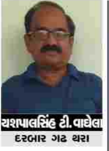
યશપાલસિંહ ડી. વાઘેલા દરબાર ગઢ થરા