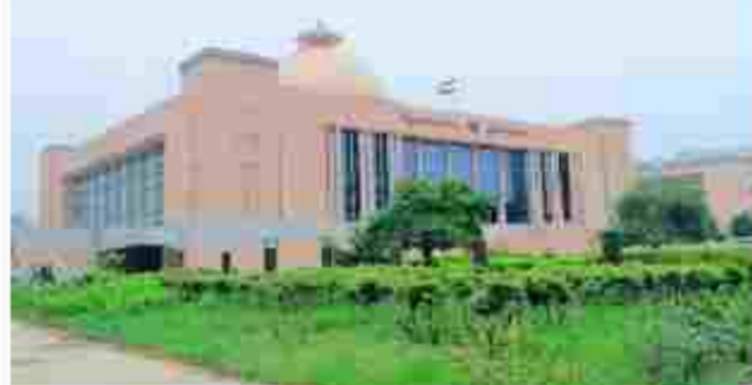
કાયદા સુધારા વિધેયકમાં મોનીટરીંગ અને એડવાઈઝરી (સલાહકાર) સમિતિની પણ દરખાસ્ત કરવામાં આવી છે જેને ચોકસાઈ વિસ્તારોમાં અભ્યાસ કરવાની જવાબદારી રહેશે.

ગાંધીનગર, તા.૧૯ ગુજરાતના અનેક શહેરોના વિસ્તારોમાં લાગુ થતાં અશાંત ધારા કાયદામાં મોટા ફેરફાર કરવાની તૈયારી કરવામાં આવી છે. રાજ્ય સરકાર દ્વારા આવતા સપ્તાહમાં સુધારા વિધેયક રજૂ કરવામાં આવશે. કાયદામાં અશાંત વિસ્તારને બદલે નિર્દિષ્ટ (સ્પેશીકાઈડ) વિસ્તારનો ઉલ્લેખ હશે.