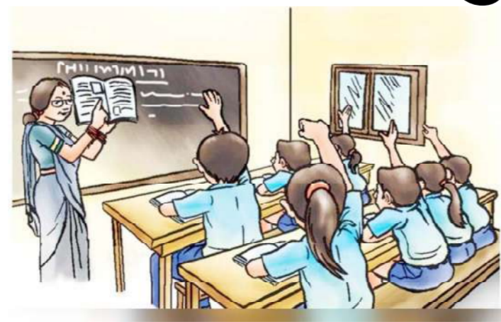
વિદ્યાર્થીઓને સહાય આપવા માટે રૂ.૨૫૦ કરોડની જોગવાઈ. જ્ઞાનશક્તિ રેસિડેન્સીયલ સ્કૂલ્સ ઓફ એક્સલન્સ માટે રૂ.૨૨૩ કરોડની જોગવાઈ. એસ.ટી. નિગમની બસોમાં મુસાફરી કરતા આશરે ૧૩ લાખ વિદ્યાર્થીઓને બસ

ગાંધીનગર તા. ૧૮ શિક્ષણ વિભાગ માટે કુલ રૂ. ૬૩૧૮૪ કરોડની જોગવાઈ કરતાં નાણામંત્રીએ જણાવ્યું હતું કે અમારી સરકારે સા વિદ્યા યા વિમુક્તયતેને ચરિતાર્થ કરતા વિમુક્તયતેને ચરિતાર્થ કરતા ઈ-કોન્ટ્રીક્ટર અને વિદ્યાર્થી કેન્દ્રિત યોજનાઓ દ્વારા શિક્ષણને વૈશ્વિક સ્પર્ધાત્મકતા તરફ દોરી જવા માર્ગ તૈયાર કરેલ છે. મિશન સ્કૂલ્સ ઓફ એક્સલન્સ અંતર્ગત પ્રાથમિક અને માધ્યમિક શાળાઓના માળખાગત સુધારણા માટે રૂ.૩૦૫૫ કરોડની જોગવાઈ.