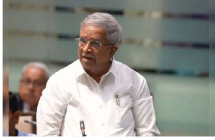
સ્વચ્છતા મિશન તથા નિર્મળ ગુજરાત ૨.૦ને એકીકૃત કરીને મુખ્યમંત્રી નિર્મળ ગ્રામ યોજના હેઠળ રૂ.૬૫૦ કરોડની જોગવાઈ. સક્ષમ ગ્રામ સમૃદ્ધ ગ્રામ હેઠળ રૂ.૬૭ કરોડની જોગવાઈ. મુખ્યમંત્રી ગ્રામોત્થાન યોજના હેઠળ રૂ.૩૦ કરોડની જોગવાઈ. ગ્રામ્ય

ગાંધીનગર તા. ૧૮ રાજ્યના નાણામંત્રી કનુભાઈ દેસાઈએ આજના અંદાજ પત્રમાં પંચાયત ગ્રામ ગૃહનિર્માણ અને ગ્રામ વિકાસ વિભાગ માટે રૂ.૧૪,૮૫૮ કરોડની જોગવાઈ કરતાં જણાવેલ હતું કે ગામડાના છેવાડાના માનવીને પણ તમામ સરકારી યોજનાઓનો લાભ મળી રહે તે રાજ્ય સરકારનું લક્ષ્ય છે. પ્રધાનમંત્રી આવાસ યોજના થકી રાજ્યના ગ્રામીણ વિસ્તારમાં વસતા પરિવારોને પોતાનું પાકું ઘર પ્રદાન કરવા છેલ્લા ૭ વર્ષમાં ૨ લાખ ૫૨ હજારથી વધુ આવાસોનું નિર્માણ કરેલ છે. તેમજ આગામી વર્ષમાં આશરે ૧ લાખ ૬૦ હજારથી વધુ આવાસોનું નિર્માણ કરવાનું આયોજન છે. ગુજરાત સ્વચ્છ ગામ, સ્વસ્થ ગામ યોજના, મહાત્મા ગાંધી