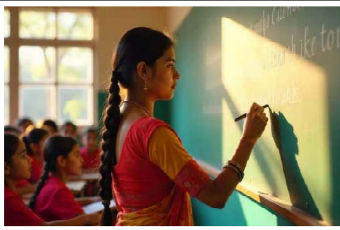
કોલેજ ફાળવવામાં આવ્યા છે.

ગાંધીનગર તા. ૧૮ રાજ્ય સરકારના નાણાં મંત્રી કનુભાઈ દેસાઈ દ્વારા આજે વિધાનસભામાં રજૂ કરાયેલા રાજ્ય સરકારના અંદાજ પત્રમાં શિક્ષણ વિભાગ માટે રૂ.૬૩૧૮૪ કરોડની જોગવાઈ કરવામાં આવી છે. જેમાં રાજ્યમાં વધુ નવી ૧૬ સરકારી કોલેજો શરૂ કરવા માટે આયોજન કરવામાં આવેલ છે. તેની સાથોસાથ સૌરાષ્ટ્રના પાટનગરસમા રાજકોટમાં રૂ. ૩૧ કરોડના ખર્ચે એનસીસી લીડરશીપ એકેડેમી નિર્માણ કરવામાં આવનાર છે.