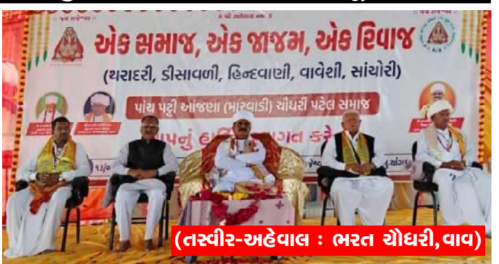
(તસ્વીર-અહેવાલ : ભરત ચૌધરી, વાવ)

(ગરવી તાકાત) વાવ તા. ૧૮ વાવ-થરાદ પંથકના મારવાડી ચૌધરી સમાજ દ્વારા સામાજિક એકતા અને સંસ્કારોને વધુ મજબૂત બનાવવા એક મહત્વપૂર્ણ અને દુરદેશી પગલું ભરવામાં આવ્યું છે. સમાજની વિશાળ બેઠક રાજેશ્વર ધામ, ચાગડા ખાતે યોજાઈ હતી, જેમાં "એક સમાજ - એક જાજમ - એક રિવાજ"ના સૂત્ર સાથે સમાજનું નવું બંધારણ તૈયાર કરી તેને આખરી ઓપ આપવામાં આવી હતી.