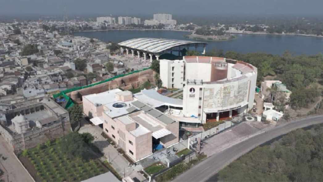
PRERNA SCHOOL PRECINCT - AFTER

વડનગરના ૨૫૦૦ વર્ષ જૂના ગૌરવશાળી ઇતિહાસને સંરક્ષિત કરવા માટે આર્કિયોલોજિકલ એક્સ્પરિન્સિયલ મ્યુઝિયમનું ગત વર્ષે ઉદ્ઘાટન કરવામાં આવ્યું હતું. ૩૦૦ કરોડના ખર્ચે બનેલ આ સંગ્રહાલય ભારતનું એકમાત્ર સંગ્રહાલય છે જે નવા ખોદકામમાંથી મળેલી વસ્તુઓ પ્રદર્શિત કરે છે. મ્યુઝિયમમાં ૫ હજારથી વધુ કલાકૃતિઓ પ્રદર્શિત કરવામાં આવી છે અને વિવિધ સમયગાળાની કલાઓ, શિલ્પો, વિવિધ ભાષાને પ્રદર્શિત કરતી ૯ થીમેટિક ગેલેરી પણ બનાવવામાં આવી છે. તો વડાપ્રધાન શ્રી નરેન્દ્ર મોદીની શૈક્ષણિક યાત્રા જ્યાંથી શરૂ થઈ હતી, તે પ્રેરણા સ્કૂલ (સંકુલ)ને ભવિષ્યની આધુનિક શૈક્ષણિક સંસ્થા તરીકે વિકસિત કરવામાં આવી છે, જેમાં નવી ટેકનોલોજી દ્વારા શિક્ષણ અને નૈતિક મૂલ્યોનો અનોખો સંગમ છે. તે વિશ્વનું પ્રથમ અનુભવાત્મક જ્ઞાન-આધારિત શિક્ષણ કેન્દ્ર છે. આ ઉપરાંત, વડનગરમાં અત્યાધુનિક સુવિધાઓ ધરાવતા સ્પોર્ટ્સ કોમ્પ્લેક્સનું પણ નિર્માણ કરવામાં આવ્યું છે, જેમાં હોસ્ટેલમાં કોચ ઓફિસ, રેક્ટર ક્વાર્ટર, આધુનિક રસોડું, ડાઇનિંગ રૂમ, રિક્રિએશન રૂમ સહિતની સુવિધાઓ તેમજ સોલાર સિસ્ટમ અને સીસીટીવી કેમેરા જેવી આધુનિક સુવિધાઓનો સમાવેશ થાય છે.