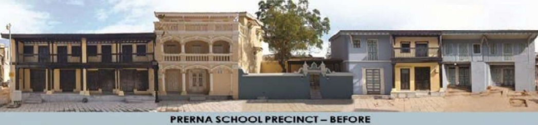
PRERNA SCHOOL PRECINCT - BEFORE