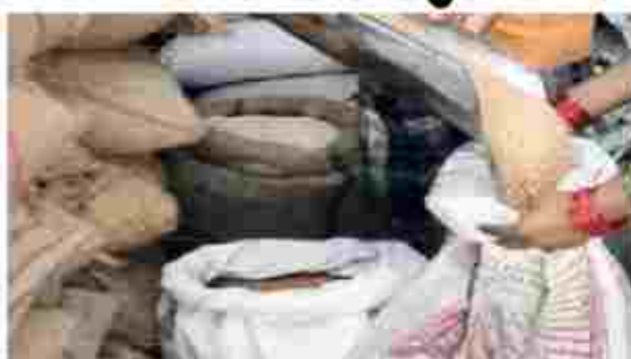
કાયદા હેઠળ વ્યક્તિ દીક ૫-કિલો અનાજની જોગવાઈ છતા અંત્યોદય રેશન કાર્ડ ધારકોને ફિક્સ ૩૫-કિલો જ અનાજ અપાય છે. એ.પી.એલ કાર્ડ ધારકની જનસંખ્યા આઠથી વધુ હોય છતા ૩૫-કિલો જ વિતરણ. ઓલ ગુજરાત ફોર પ્રાઈઝ એસો. દ્વારા મુખ્યમંત્રીને ખાસ પત્ર પાઠવાયો

(ગરવી તાકાત) ગાંધીનગર તા. ૧૯ રાષ્ટ્રિય અન્ન સલામતિ કાયદા હેઠળ કરેલ રેશનકાર્ડ પારકને વ્યક્તિદીક પાંચ કિલો અનાજ મળવાપાત્ર છે પરંતુ અંત્યોદય રેશનકાર્ડની કેટેગરીમાં રેશનકાર્ડ દીક ફિક્સ ૩૫ કિલો અનાજ આપવામાં આવે છે જેના કારણે કોઈ રેશનકાર્ડમાં આક કે તેથી વધારે જનસંખ્યા હોય તો પણ તેઓને ફક્ત ૩૫ કિલો જ અનાજ મળે છે જે આ કાયદાનું ઉલ્લંઘન છે અને લાભાર્થીને મળવાપાત્ર પૂરના જથ્થાથી વધત રહેતું પડે છે.