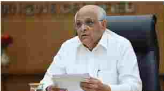
મુખ્યમંત્રી ભૂપેન્દ્ર પટેલે ટેક્સટાઈલ પોલીસી-૨૦૨૪નો લાભ અપાશે.

ગાંધીનગર, તા. ૧૯ મુખ્યમંત્રી ભૂપેન્દ્ર પટેલે ટેક્સટાઈલ પોલીસી-૨૦૨૪માં પહેલી વાર ગ્રામીણ અને શહેરી વિસ્તારોની મહિલાઓના સ્વ સહાય જુથ - સેલ્ફ હેલ્પ ગ્રુપના સહકાર અને આવક વૃદ્ધિનો અભિગમ અપનાવીને કેટલીક જોગવાઈઓમાં મહત્વપૂર્ણ સુધારા કરવાના ડિશા નિર્દેશો આપ્યા છે.