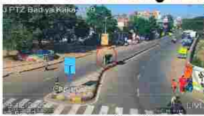
માંધીનગર, તા. ૧૯ ગુજરાતના શહેરોને સ્માર્ટ બનાવવા માટે રાજ્ય સરકાર આધુનિક ટેકનોલોજી અને આર્ટિફિશિયલ ઈન્ટેલિજન્સના ઉપયોગને પ્રાથમિકતા આપી રહી છે.

માંધીનગર, તા. ૧૯ ગુજરાતના શહેરોને સ્માર્ટ બનાવવા માટે રાજ્ય સરકાર આધુનિક ટેકનોલોજી અને આર્ટિફિશિયલ ઈન્ટેલિજન્સના ઉપયોગને પ્રાથમિકતા આપી રહી છે. મુખ્યમંત્રી ભુપેન્દ્ર પટેલના નેતૃત્વમાં માંધીનગરમાં AI સેન્ટર ઓફ એક્સલન્સની સ્થાપના કર્યા બાદ આ દિશામાં આગળ વધતા અમદાવાદ મહાનગરપાલિકા વિસ્તારને આવરી લેતી સમસ્યા માટે એક મહત્વપૂર્ણ પાયલોટ પ્રોજેક્ટ શરૂ કરવામાં આવ્યું છે, જેના હેતુ આવાના ડિવિઝનમાં રખડતા પશુઓના લીધે થતા ઘટના સમસ્યાઓનું સમાધાન લાવવામાં વધુ સરળતા રહેશે.