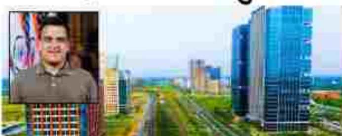
ગીફ્ટ સીટીમાં આવવા આમંત્રણ આપ્યું છે.

ગાંધીનગર તા. ૧૯ ગુજરાતમાં નિર્મિત ગીફ્ટ સીટી આંતરરાષ્ટ્રિય નાણાકીય હબ અને તે માટેની રાજ્ય સરકારની તૈયારીમાં હવે ગીફ્ટ સીટીમાં ૧૦૦થી વધુ ટોચના રેસ્ટોરન્ટને તેમની શ્રાવ્ય ખોલવા માટે આમંત્રણ અપાયું છે.