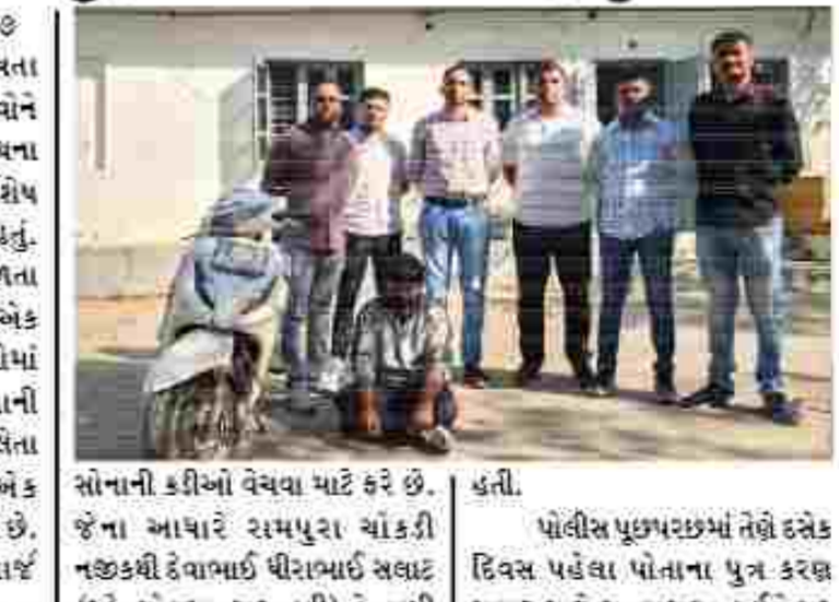
મહેસાણા જિલ્લામાં વધતા જતા હુંડલ અને છેતરપિંડીના બનાવોને ડામવા જિલ્લા પોલીસ વડાની સુચના હેઠળ એલ.સી.બી. ટીમ દ્વારા વિશેષ પેટ્રોલિંગ હાથ ધરવામાં આવ્યું હતું.