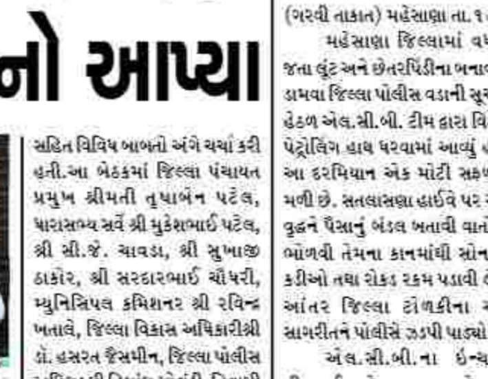
મહેસાણા જિલ્લામાં વધતા જતા હુંડલ અને છેતરપિંડીના બનાવોને ડામવા જિલ્લા પોલીસ વડાની સુચના હેઠળ એલ.સી.બી. ટીમ દ્વારા વિશેષ પેટ્રોલિંગ હાથ ધરવામાં આવ્યું હતું.