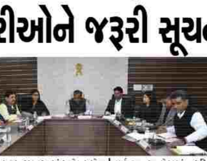
મહેસાણા જિલ્લામાં વધતા જતા હુંડલ અને છેતરપિંડીના બનાવોને ડામવા જિલ્લા પોલીસ વડાની સુચના હેઠળ એલ.સી.બી. ટીમ દ્વારા વિશેષ પેટ્રોલિંગ હાથ ધરવામાં આવ્યું હતું.