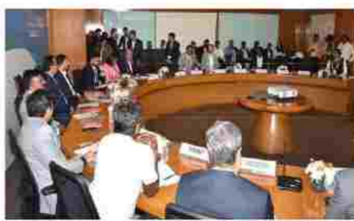
માટે વિકસિત ભારત ૨૦૪૭ના લક્ષ્યને આગળ ધરાવવાની તેમજ ભારતના નેટ-ઝીરો વિઝનને મજબૂત બનાવવા માટે એક વ્યૂહાત્મક તક પ્રદાન કરે છે. રાજ્યના વિશાળ દરિયાકાંઠા અને નવનીકરણીય ઊર્જામાં આગેવાનીનો લાભ લઈને, સ્વચ્છ અને સસ્તી વીજળી પૂરી પાડના

(ગરવી તાકાત) અમદાવાદ તા. ૧૨ પ્રધાનમંત્રી નરેન્દ્રભાઈ મોદીના હસ્તે રાજકોટ ખાતે વાઈબ્રન્ટ ગુજરાત રિજનલ કોન્ફરન્સ - કચ્છ સીરાપૂના શુભારંભ બાદ મારવાડી યુનિ. કેમ્પસ ખાતે 'ઓશન્સ ઓફ ઓપર્યુનિટી - બ્લુ એનેર્જી, ગ્રીન ફ્યુચર વિષયક' સી.ઈ.ઓ. રાઉન્ડ ટેબલ બેઠક યોજાઈ હતી.