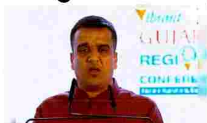
તત્કાલીન મુખ્યમંત્રી અને હાલના વડાપ્રધાનની નરેન્દ્રભાઈ મોદીએ વર્ષ ૨૦૦૩માં ગુજરાતમાં વાઈબ્રન્ટ ગુજરાત સમિતિ લોન્ચ કરીને ગુજરાતને ઈન્વેસ્ટમેન્ટ અને મેન્યુફેક્ચરિંગ દિશામાં ખૂબ મોટું પ્રોત્સાહન આપ્યું છે.

(ગરવી તાકાત) અમદાવાદ તા. ૧૨ વાઈબ્રન્ટ ગુજરાત રિજનલ સમિતિ - સીરાપૂ કચ્છના ઉદ્ઘાટન પ્રસંગે સ્વાગત પ્રવચન કરતા ગુજરાતના તાપમાન મુખ્યમંત્રી છે હર્ષ સંઘવીએ જણાવ્યું હતું કે, એક સમયે ઉદ્યોગ ભોતેમાં xવાપીથી તાપીx સુધી જ ગુજરાતે ઓળખાતું હતું.