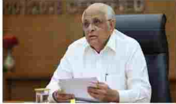
સર્વાંગી વિકાસની ઝાંખી આપતા તેમણે કહ્યું હતું કે, ગુજરાત આજે xગ્લોબલ નેટવે ટુ ધ ફ્યુચરx (ભવિષ્ય માટેનું વૈશ્વિક દ્વાર) બન્યું છે અને પ્રગતિના નવા ભેગામાર્કસેટ કરી રહ્યું છે. ઓટો સેક્ટર, સેમીકન્ડક્ટર, કાર્બોનાશિયલ સર્વિસિસ, એ.આઈ., ડાયાકાની સફળતાના પરિણામે રાજ્યમાં છેલ્લા ૨૦ વર્ષોમાં રૂ. ૩.૫૭ લાખ કરોડનું વિદેશી રોકાણના

(ગરવી તાકાત) અમદાવાદ તા. ૧૨ ગઈકાલે મારવાડી કોલેજ ખાતે રિજીયન ગુજરાત વાઈબ્રન્ટનાં પ્રારંભિક પર્ટલ જાણકારી સભર વક્તવ્ય આપતા જણાવેલ હતું કે તત્કાલીન મુખ્યમંત્રીના તથા વર્તમાન વડાપ્રધાન છે નરેન્દ્રભાઈ મોદીએ એક વિઝન સાથે વર્ષ ૨૦૦૩માં વાઈબ્રન્ટ ગુજરાત સમિતિ શરૂ કરાવીને ગુજરાતની ઉદ્યોગ સંભાવનાને વિશ્વ સમક્ષ મૂકી હતી.