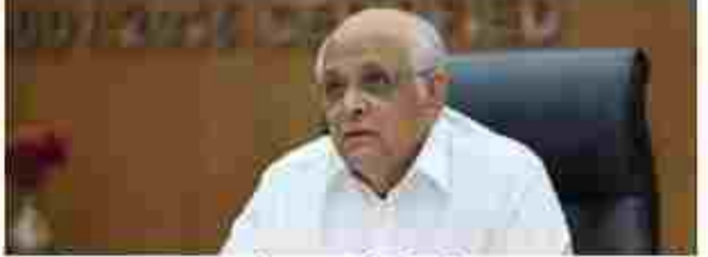
૨૬મની ગ્રાન્ટ ફાળવવાની પ્રથા પ્રવર્તમાન છે. મુખ્યમંત્રી સમક્ષ જિલ્લા પંચાયતના પ્રમુખનેઓએ પોતાના જિલ્લામાં ગ્રામીણ વિકાસ કામોને વેમ મળે અને સ્થાનિક અગત્યતા ધરાવતા કામોને પ્રાથમિકતા આપી શકાય તેવા આશયે જિલ્લા પંચાયતના પ્રમુખોને પણ

ગાંધીનગર, તા. ૧ મુખ્યમંત્રી ભૂપેન્દ્ર પટેલે રાજ્યના જિલ્લાઓના ગ્રામ્ય વિસ્તારોના સર્વસ્રાહી અને સર્વસમાવેશી વિકાસ માટે મહત્વપૂર્ણ જનહિતલક્ષી નિર્ણય કર્યો છે. આ હેતુસર મુખ્યમંત્રીએ રાજ્યની બધી જ ૩૪ જિલ્લા પંચાયતોના પ્રમુખોને રૂ. ૧ કરોડની વિવેકાધીન ગ્રાન્ટ જે-તે જિલ્લાના સ્થાનિક અગત્યતા પરાવતા વિકાસ કામો માટે ફાળવવાના ડિશનરિટેશો આપ્યાં છે.