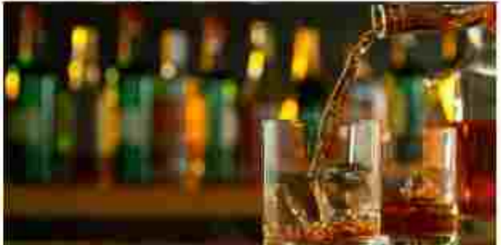
૨૦૨૨ - ૪૦,૯૨૧, ૨૦૨૩- ૪૩,૪૭૦, ૨૦૨૪ - ૪૫,૦૦૦, ૨૦૨૫ - ૪૫,૫૦૦ છે. સૂત્રોના જણાવ્યા પ્રમાણે, ડાહ્યાના સ્ટોર્સ પર હેલ્થ પરમિટ સાથે જોડાયેલા ગ્રાહકોની સંખ્યામાં ચોક્કસપણે નરમાશ આવી છે. અમદાવાદમાં નવી હોટેલો ખુલવાની સાથે સ્ટોર્સની સંખ્યા વધી છે. જોકે, પરમિટની સંખ્યા સ્થિર રહેતા ધણા આઉટલેટ્સમાં માંગ અટકી ગઈ છે અને કેટલાક ડિસ્તાઓમાં તો સ્ટોર્સ નુકસાનમાં જઈ રહ્યા છે. આની સીધી અસર નિયમિત વ્યવસાય પર પડી રહી છે, ખાસ કરીને એવા સ્ટોર્સ જે નવા પરમિટ કરતા રિન્યુઅલ પર વધુ નિર્ભર હતા.

અમદાવાદ, તા. ૧ રાજ્યમાં વર્ષો સુધી જોવા મળેલી સતત વૃદ્ધિ બાદ, હવે ગુજરાતમાં ડાહ્યાના હાલેલ્લે પરમિટ ધારકોની સંખ્યા એક સરે આવીને અટકી ગઈ હોય તેમ લાગે છે. રાજ્ય સરકારના આંકડા દર્શાવે છે કે સક્રિય લિકર હેલ્થ પરમિટ ધારકોની સંખ્યામાં નોંધપાત્ર વધારો થયો છે.