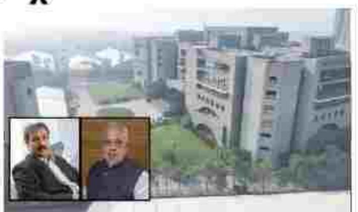
મારવાડી યુનિવર્સિટી ધાલમાં એન્જિનિયરિંગ, મેનેજમેન્ટ, ગ્રામીણ, લો, કોમ્પ્યુટર ગ્રામીણ, નર્સિંગ, સાયન્સ તથા કમ્પ્યુટર એપ્લિકેશન સહિતના વિવિધ અભ્યાસક્રમો સફળતાપૂર્વક ચલાવી રહી છે. યુનિવર્સિટીમાં ધાલ વિષ્ણુના ૫૪ ટેશો તથા ભારતના ૨૨ રાજ્યોમાંથી આવેલા વિદ્યાર્થીઓ અભ્યાસ કરી રહ્યા છે. ઉત્તમ પ્લેસમેન્ટ રેકોર્ડ અને અત્યાધુનિક શિક્ષણ વ્યવસ્થાના કારણે મારવાડી યુનિવર્સિટી વિદ્યાર્થીઓ માટે પ્રથમ પસંદગી બની છે.

રાજકોટમાં આગામી ૧૧-૧૨મીએ મારવાડી યુનિવર્સિટીમાં યોજાવાની સૌરાષ્ટ્ર એન-ટી વાઈબ્રન્ટ સમીટમાં મારવાડી યુનિવર્સિટી સુપર ૧૦૦૦ કરોડના રોકાણના કરાર કરશે. જે સ્થળે સમીટ યોજાવાની છે તે જ ૧૦ એકરની જગ્યામાં યુનિવર્સિટીનું વિસ્તરણ કરવા સાથે નવા અભ્યાસક્રમો તથા શૈક્ષણિક ઈન્ફ્રાસ્ટ્રક્ચરમાં રોકાણ કરવામાં આવશે.