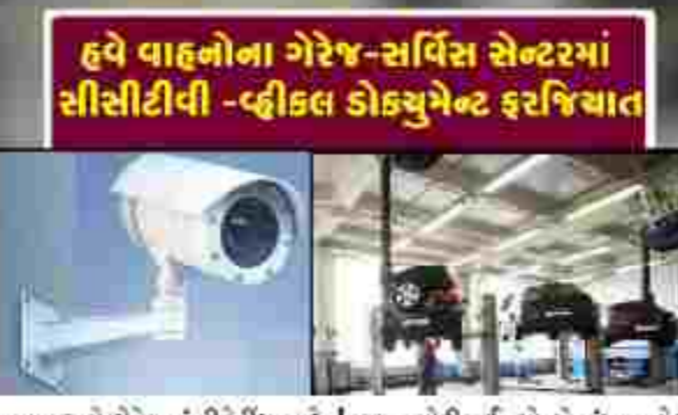
હવે વાહનોના ગેરેજ-સર્વિસ સેન્ટરમાં સીસીટીવી -હીકલ ડોક્યુમેન્ટ ફરજિયાત

સંદર્ભમાં હવે રાજ્ય પોલીસે ગેરેજમાં રીપેરમાં આવતા તમામ વાહનોનું ડેટા પણ ગેરેજ માલિકે રાખવા પડશે. ગેરેજમાં એન્ટ્રી અને એક્ઝિટ પોઈન્ટ અને પુરા ગેરેજના ત્રણેય રેકોર્ડ થાય તે રીતે સીસીટીવી પણ સાંપભા પડશે અને આ રેકોર્ડ નિશ્ચિત સમય સુધી જાળવી રાખવા જરૂરી બનશે એટલું જ નહીં વાહન રીપેરીંગ માટે આવતા વ્યક્તિનો ઓળખનો પુરાવો પણ મેળવવાનો રહેશે. નવંબર ભારતીય ન્યાય સંહિતાની કલમ ૨૨૩ હેઠળ ગેરેજ સંચાલક સામે કામ ચલાવી શકાશે. આમ પોલીસે પોતાની તપાસ પધ્ધતિમાં હવે વાહન ગેરેજને પણ મહત્વની જગ્યાબદલી સોંપી છે.