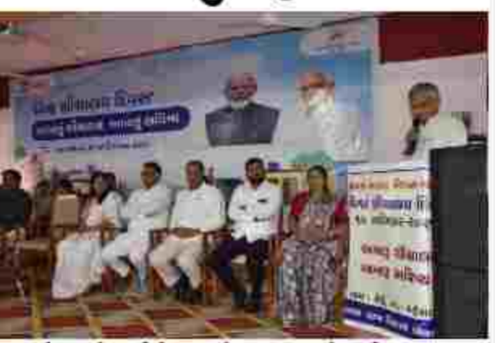
૧૯ નવેમ્બર થી ૧૦ ડિસેમ્બર સુધી