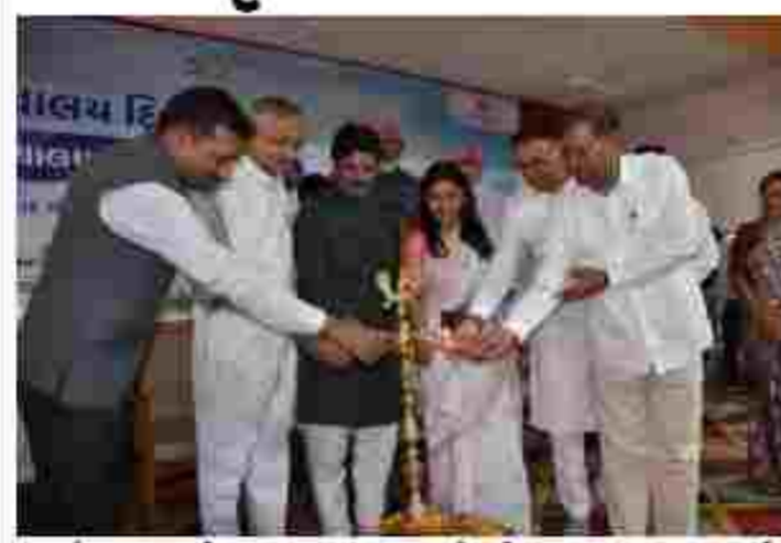
મહેસાણા તા. ૧૯

દર વર્ષે સમગ્ર વિશ્વમાં તા. ૧૯ નવેમ્બરને વિશ્વ શૌચાલય દિવસ ઉજવવામાં આવે છે. જેના ભાગરૂપે ગ્રામ વિકાસ મંત્રીશ્રી કુવરજી બાવળિયાના અધ્યક્ષસ્થાને મહેસાણા જિલ્લાના મેઈ ખાતે રાજ્યકક્ષાના વિશ્વ શૌચાલય દિવસની ઉજવણી કરવામાં આવી હતી. આ પ્રસંગે સંબોધન કરતા ગ્રામ વિકાસ મંત્રીશ્રી કુવરજીબાઈ બાવળિયાએ જણાવ્યું હતું કે, ગામડાઓ દેશની કલારૂઝ સમાન છે, જો ગામડાઓ સ્વચ્છ, સુંદર અને સમૃદ્ધ બનશે તો દેશ પણ સ્વચ્છ અને સમૃદ્ધ બનશે. ગાંધીજી સ્વચ્છતા અને સ્વદેશી અપનાવવા માટે હંમેશા આગ્રહ રાખતા હતા. આથી સ્વચ્છતાને અગ્રતાકામ આપી પ્રધાનમંત્રીશ્રી નરેન્દ્રમોદી દ્વારા વર્ષ ૨૦૧૬માં સ્વચ્છ ભારત મિશન