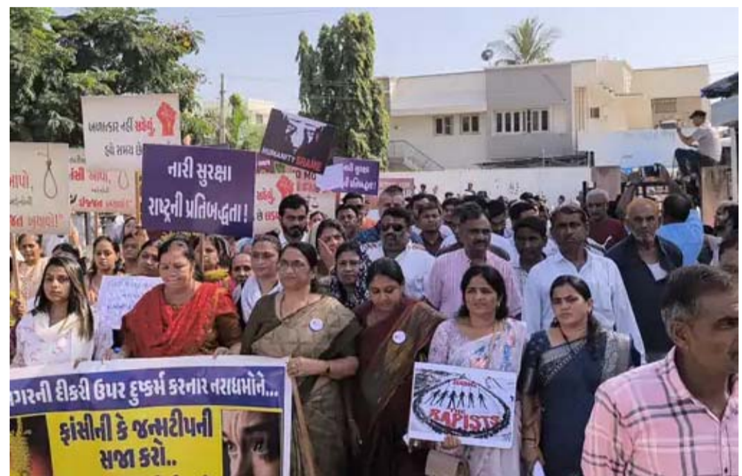
સંદર્ભમાં પોલીસે આરોપીને ઝડપી પાડી અને કાયદેસરની કાર્યવાહી શરૂ કરેલી છે. એ કાર્યવાહીમાં યોગ્ય અને સમાજના લોકોએ ભેગા થઈ અને યોગ્ય કાર્યવાહી માટે આવેદનપત્ર અગ્રણીઓ જે અલગ અલગ આપ્યું છે.