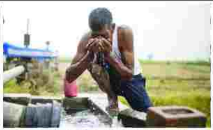
૧૬૬૭૪ ફરિયાદો નોંધાઈ છે. જ્યારે અન્ય રાજ્યોમાં સરકારના મધ્યપ્રદેશ, ત્રિપુરા, પશ્ચિમ બંગાળ, છત્તીસગઢ, ગુજરાત, હરિયાણા વગેરેનો સમાવેશ થાય છે. સરકારી

નવી દિલ્હી તા. ૧૦ વડાપ્રધાન નરેન્દ્ર મોદીની મહત્વાકાંક્ષી જલયુજન યોજનામાં ભારે ભ્રષ્ટાચાર થયાં હોવાના ધડાકા બાદ કેન્દ્રીય એજન્સીએ ગુજરાત સહિતના ૧૫ રાજ્યો અને કેન્દ્રશાસીત પ્રદેશોમાં તપાસ શરૂ કરી છે અને તેમાં હવે સીબીઆઈને પણ જોડવામાં આવે તેવી શક્યતા છે. પરંવરે નળ દ્વારા પીવાનું પાણી પુરુ પાડવાની આ યોજનામાં ગુજરાત પણ જોડાયું છે અને રાજ્યમાં પણ આ અંગે ભારે ભ્રષ્ટાચાર થયાં હોવાનું અગાઉ અનેક સમયે બહાર આવ્યું હતું જેમાં ૧૬૬૭૪ ફરિયાદો મળી છે. ઉત્પ્રદેશમાં સૌથી વધુ