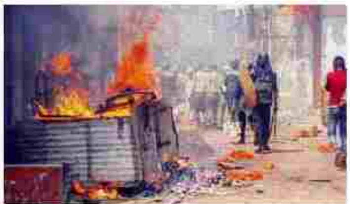
ટેમ્પોમાંથી લોકો ફૂટીને દોડવા લાગ્યા. ફરિયાદી મહિલાનો પીછો કરીને કેટલાક લોકોએ તેમના હાથમાં તલવારના ચા મચાવ્યા. મહિલા મૃત્યુ પામ્યા હોવાનું નાટક કરીને કેમ્બે પાછળ પડી રહ્યા, ત્યારે તેમણે ટોળામાંથી ફૂટીને ટેમ્પો ઉપર કેરોલીન નાખીને સળગાવી દેવાની વાત સાંભળી, અને તે મુજબ કૃત્ય આચરવામાં આવ્યું.

(ગરવી તાકાત) અમદાવાદ તા. ૧૦ વર્ષ ૨૦૦૨ના ગુજરાત રમખાણો સંબંધિત એક કેસમાં, ગુજરાત હાઈકોર્ટે રાજ્ય સરકાર દ્વારા દાખલ કરવામાં આવેલી અપીલને ફાલ્ગુ દીક્ષીથી અને ગોધરા ફાસ્ટ ટ્રેક સેન્સશન કોર્ટના વર્ષ ૨૦૦૩ના ચુકાદાને યોગ્ય ઠેરવ્યો છે.