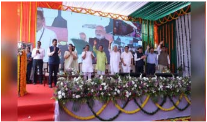
થયેલી બ્રહ્મપુર-ઉદના અમૃત ભારત ટ્રેનથી ગુજરાતના ઉડિયા લોકોને લાભ થશે.

આ પ્રસંગે ઓરિસ્સા અને ગુજરાતમાં કાર્યક્રમો યોજાયા હતાં. ઓરિસ્સામાં જનસભાને સંબોધીત કરતા વડાપ્રધાન મોદીએ ગુજરાતને પ્રથમ અમૃત ભારત ટ્રેનની ભેટ આપતા જણાવ્યું હતું કે આજથી શરૂ