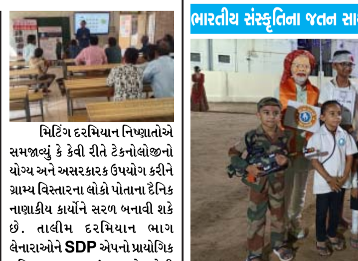
મિટિંગ દરમિયાન નિષ્ણાતોએ સમજાવ્યું કે કેવી રીતે ટેકનોલોજીનો યોગ્ય અને અસરકારક ઉપયોગ કરીને ગ્રામ્ય વિસ્તારના લોકો પોતાના દૈનિક નાણાકીય કાર્યોને સરળ બનાવી શકે છે. તાલીમ દરમિયાન ભાગ લેનારાઓને SDP એપનો પ્રાયોગિક પરિચય આપવામાં આવ્યો, જેથી તેઓ પોતાના રોજિંદા જીવનમાં તેનો ઉપયોગ કરી શકે.

(ગરવી તાકાત) ઈડર તા.૨૮ તાજેતરમાં નરસિંહભાઈ દેસાઈ સેન્ટર ફોર ફરિયર ડેવલપમેન્ટ દ્વારા આસપાસના ગામોના લોકોને ધ્યાનમાં રાખીને ડિજિટલ અને ફાઈનાન્સિયલ લિટરસી વિષયક વિશેષ મિટિંગનું આયોજન કરવામાં આવ્યું હતું. આ મિટિંગનો મુખ્ય હેતુ ગ્રામ્ય વિસ્તારના નાગરિકોને ડિજિટલ યુગમાં નાણાકીય વ્યવહારો અંગે જાગૃત બનાવવાનો અને તેમને સુરક્ષિત પદ્ધતિઓ વિશે માહિતગાર કરવાનો હતો.