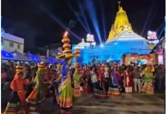
પોતાની પ્રસ્તુતિ આપવામાં આવે છે. નવરાત્રી પર્વને લઈને અંબાજી મંદિરને રંગબેરંગી રોશનીથી શણગારવામાં આવ્યું છે. મંદિરની આ ભવ્ય રોશની જોઈને ભક્તો આનંદ અને ભક્તિની લાગણી અનુભવે છે.