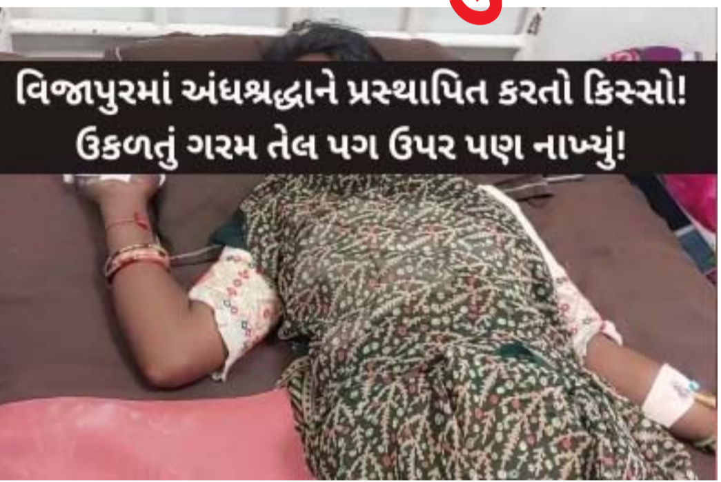
વિજાપુરમાં અંધશ્રદ્ધાને પ્રસ્થાપિત કરતો કિસ્સો! ઉકળતું ગરમ તેલ પગ ઉપર પણ નાખ્યું!

તેના પગ પર પણ ગરમ તેલ રેડવામાં આવ્યું હતું. આ ફૂર કૃત્યને કારણે પરણીતા ગંભીર રીતે દાગી ગઈ હતી. આ ભયાનક ઘટના બાદ, પીડિત પરણીતાએ નણદોઈ જમના ઠાકોર, નણદોઈ મનુ ઠાકોર અને અન્ય બે ઈસમો સહિત કુલ ચાર વ્યક્તિઓ સામે ફરિયાદ નોંધાવી છે. વિજાપુર પોલીસ સ્ટેશનમાં આ મામલે ફરિયાદ નોંધાઈ છે અને પોલીસે વધુ તપાસ હાથ ધરી છે. આ ઘટના સમાજમાં ઊંડી ઉતરી ગયેલી અંધશ્રદ્ધા અને વહેમને દર્શાવે છે. આધુનિક યુગમાં પણ આવા બનાવો બનવા એ ચિંતાજનક છે. આ કિસ્સો કાયદા અને માનવતા બંને માટે એક પડકાર સમાન છે.