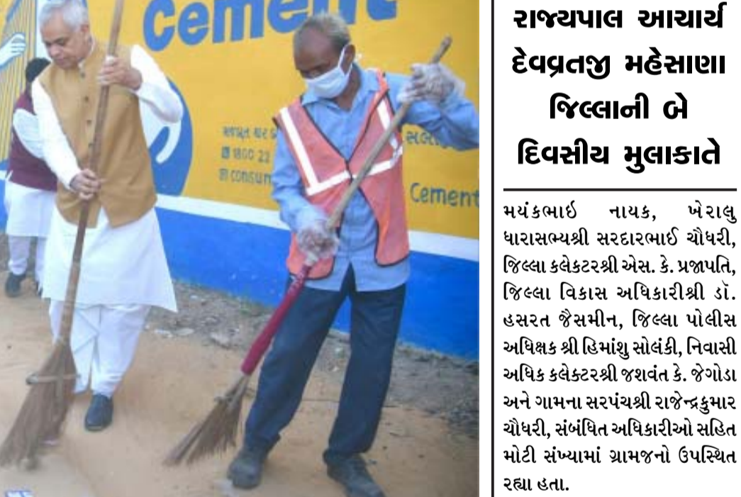
રાજ્યપાલ આચાર્ય દેવવ્રતજી મહેસાણા જિલ્લાની બે દિવસીય મુલાકાતે

આયોજિત વૃક્ષારોપણ કાર્યક્રમમાં રાજ્યપાલશ્રીએ વડનું વૃક્ષ રોપીને પર્યાવરણ સંરક્ષણ થકી હરિયાળા ગુજરાતનો સંદેશ આપ્યો હતો. આ ઉપરાંત રાજ્યપાલશ્રીએ સ્થાનિક સફાઈકર્મીઓ અને ગ્રામજનો સાથે સ્વચ્છતા હાથ ધર્યું હતું. સ્વચ્છતા બાદ રાજ્યપાલશ્રીએ વડાપ્રધાન શ્રી નરેન્દ્ર મોદીના સ્વચ્છતા અભિયાનનો ઉલ્લેખ કરતા ગ્રામજનોને સ્વચ્છતાનું મહત્વ સમજાવ્યું હતું. તેમણે ગામના સફાઈ કર્મીઓને ભિરદાવ્યા હતા અને સ્વચ્છતાને સંસ્કાર બનાવવાની પણ તેમણે અપીલ કરી હતી. આ કાર્યક્રમમાં મહેસાણા લોકસભા સાંસદશ્રી હરિભાઈ પટેલ, પાટણ લોકસભા સાંસદશ્રી ભરતસિંહ ડાભી, રાજ્યસભા સાંસદશ્રી