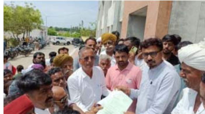
બંધ થયાના ૧૦ દિવસ બાદ પણ હજુ સુધી એક પણ પૂર પીડિત વ્યક્તિને કેસોલ્સ ચૂકવવામાં આવી નથી, સર્વે ટીમ હજુ ડેટા એકઠા કરવામાં વ્યસ્ત છે, મોટાભાગના ગામોમાં નીચાણ વાળા વિસ્તારોના ઘરો હજુ પણ પૂરના પાણીમાં

તાડપત્રીઓ લગાવી વસવાટ કરવો પડી રહ્યો છે, જવાબદાર વહીવટીતંત્ર દ્વારા દરેક ગામોમાં પશુ મૃત્યુ, પાક ધોવાણ, જમીન ધોવાણ મકાન સર્વે, તેમજ કેસોલ્સ અને ઘરવખરી સહાય માટેનું સર્વે કામ હાથ ધરાયું છે, વરસાદ બંધ થયાને ૧૦ દિવસ બાદ પણ હજુ સુધી લોકોને કેસોલ્સ કે ઘરવખરી સહાય ચૂકવવામાં આવી નથી, ગામડે ગામડે પાણી ભરાયેલા છે, લોકોને ગામમાં અવર જવર કરવાની પણ મુશ્કેલી છે, એક બાજુ લાઈટના અભાવે કે સહાય માટે જરૂરી ડોક્યુમેન્ટની ઝીરો માટે લોકોને તાલુકા મથકના ધરમધકકા ખાવા મજબૂર બનવું પડી રહ્યું છે, તમામ ગામોમાં રેશનકાર્ડની વિગતો છે, અને તમામ રેશનકાર્ડ આધારકાર્ડથી ચિક