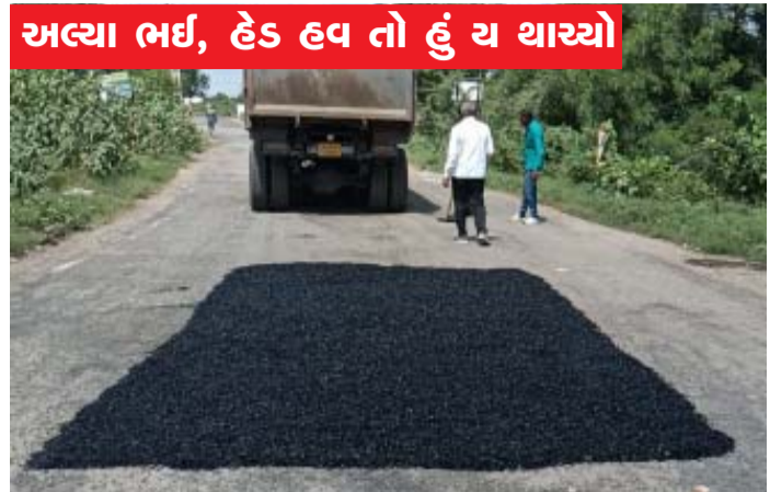
અલ્યા ભઈ, હેડ હવ તો હું ચ થાયો