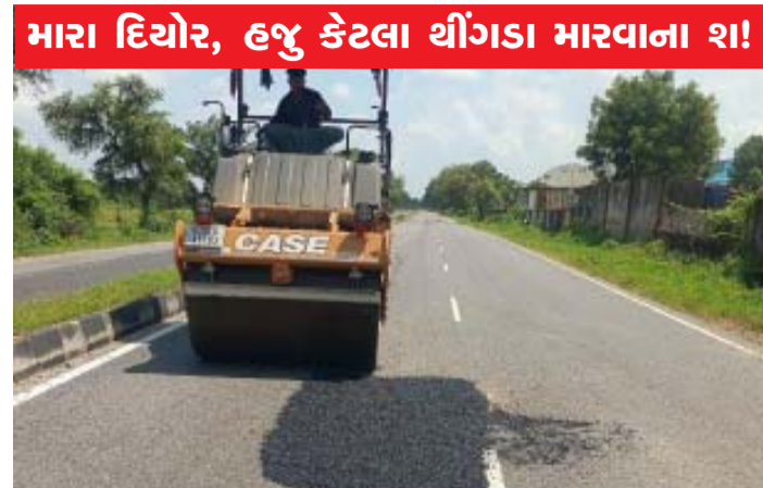
મારા દિયોર, હજુ કેટલા થીગડા મારવાના શ!

મહેસાણા જિલ્લામાં ચોમાસા દરમિયાન નુકશાન પામેલા માર્ગોની મરામત મહેસાણા જિલ્લામાં ભારે વરસાદના કારણે નુકશાન પામેલા રસ્તાઓનું સમારકામ કરવામાં આવી રહ્યું છે. વરસાદના વિરામ બાદ જિલ્લામાં માર્ગ અને મકાન (પંચાયત) હસ્તકના માર્ગોની માર્ગ અને મકાન (પંચાયત) દ્વારા ડામર કામથી મરામત કામગીરી કરવામાં આવી રહી છે. મોન્સુન બાદ હાથ ધરાયેલા માર્ગ સુધારણાની કામગીરી મહેસાણા જિલ્લાના સતલાસણા તાલુકાના રાણપુર - જસપુરીયા રોડ, મહેસાણામાં તળેટી-મોહનપુરા રોડ તેમજ કડી તાલુકાના કાસવા એપ્રોચ રોડ વગેરે રસ્તાઓ પર કરવામાં આવી હતી. અહીં ડામર પેચવર્ક સાથે માર્ગની સરફેસ દુરસ્ત કરી તેને રાહદારીઓ અને વાહન ચાલકોને સરળ અને સુરક્ષિત મુસાફરી મળી રહે તે માટે સુગમ્ય બનાવવામાં આવી રહ્યા છે. ઉલ્લેખનીય છે કે, રાજ્ય સરકારે તમામ ક્ષતિગ્રસ્ત માર્ગોના મરામતની આપેલી સૂચના બાદ મહેસાણા જિલ્લાના માર્ગ અને મકાન (પંચાયત) વિભાગ હસ્તક માર્ગો ઉપર ડામર પેચવર્કની કામગીરીનો આરંભ કરી દેવામાં આવ્યો છે.