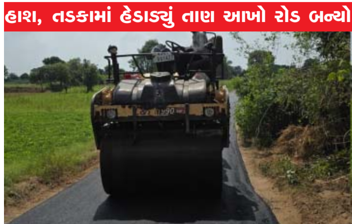
હાશ, તડકામાં હેડાડ્યું તાણ આખો રોડ બન્યો