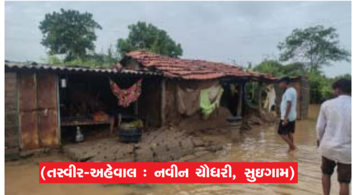
(તસ્વીર-અહેવાલ : નવની ચોધરી, સુઈગામ)

ગુજરાતના મુખ્યમંત્રીશ્રીએ જાત નિરીક્ષણ કર્યાના ૭ દિવસ બાદ પણ પૂર સહાય માટેની કોઈ જાહેરાત નહીં કરતાં સરકારની નિયત પર સવાલો..