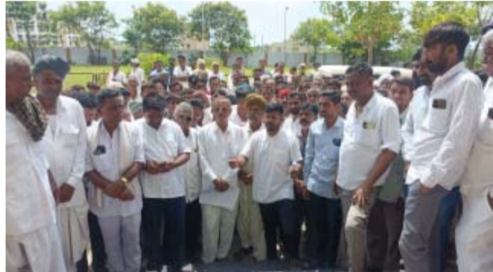
વાવ, ભાભર તાલુકામાં ઘાસચારાનું તણખલુંય અપાયું નથી