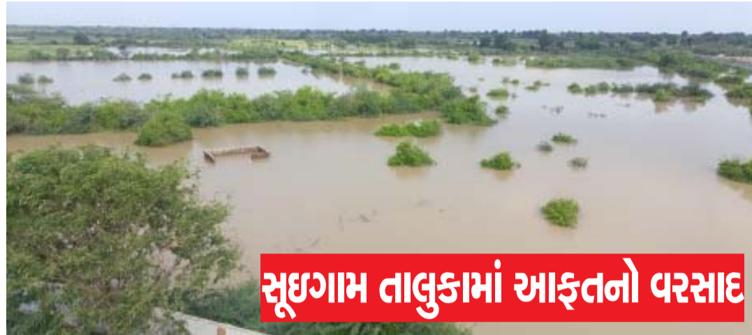
સુઈગામ તાલુકામાં આફતનો વરસાદ

સુઈગામ તરફ આવવા જવા માટેના સ્ટેટ તેમજ નેશનલ અને સિંગલ પટ્ટી રસ્તાઓ પાણીમાં