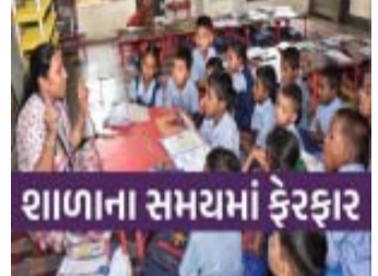
શાળાના સમયમાં ફેરફાર

કરીને, શિક્ષણ ક્ષેત્રે કાર્યરત પ્રાથમિક શિક્ષકો પણ આ સમાજોપયોગી પ્રવૃત્તિમાં પોતાનું યોગદાન આપવા ઉત્સાહિત છે. આ મહાન કાર્યમાં શિક્ષક ભાઈ-બહેનો સરળતાથી ભાગ લઈ શકે તે હેતુથી, આદિજાતિ વિકાસ, પ્રાથમિક, માધ્યમિક અને પ્રોદ શિક્ષણના કાર્યાલય દ્વારા એક મહત્વપૂર્ણ નિર્ણય લેવામાં આવ્યો છે. તા. ૧૬/૦૮/૨૦૨૫, મંગળવારના રોજ રાજ્યની તમામ સરકારી પ્રાથમિક શાળાઓનો સમય સવારે ૮:૦૦ થી ૧૧:૦૦ કલાક સુધીનો રહેશે. આ ફેરફાર ફક્ત આ એક જ દિવસ પૂરતો લાગુ પડશે, જેથી શિક્ષકો સવારે ૧૧ પછી ૩૦૦થી વધુ સ્થળોએ આયોજિત રક્તદાન શિબિરમાં ભાગ લઈ શકે. રક્તદાન એ જીવનદાન છે. એક નાનકડું યોગદાન કોઈના જીવનને બચાવી શકે છે. રાજ્યના તમામ પ્રાથમિક શિક્ષકોને આ અવસરનો લાભ લઈને આ માનવતાના મહાદાનમાં જોડાઈ, સમાજ પ્રત્યેની પોતાની ફરજ નિભાવવા અપીલ છે. આ નિર્ણય શિક્ષકોને સમાજસેવામાં જોડાવા માટે પ્રોત્સાહિત કરશે અને રક્તદાનના મહત્વ વિશે જાગૃતિ પણ ફેલાવશે.