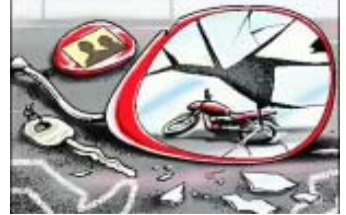
જ્યુપિટર પર મકતુપુર ફેક્ટરી તરફ જઈ રહ્યા હતા. એચપી પેટ્રોલપંપ પાસે રોડ ક્રોસ કરતી વખતે સિદ્ધપુર તરફથી આવી રહેલી સફેદ કારે તેમને

રાખવી પડી છે. ધીમી ગતિએ વાહન ચલાવવા છતાં રસ્તા પર વિશેષ સાવચેતી રાખવી પડી રહી છે. ધુમ્મસની સોથી વધુ અસર વહેલી સવારે મુસાફરી કરતા લોકો અને શાળાએ જતા વિદ્યાર્થીઓ પર થઈ છે. ધુમ્મસના કારણે વાતાવરણમાં ઠંડક વધી છે. દિવસ ચડતાની સાથે ધુમ્મસ હળવું થવાની આશા છે. આ અચાનક બદલાયેલા વાતાવરણે લોકોમાં આશ્ચર્ય અને કુતૂહલ જગાવ્યું છે.