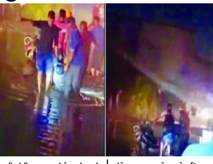
પાણીમાંથી પસાર થયું કે, તુરંત કરંટ લાગતા વાહન પર બેઠેલા યુવક અને યુવતી બંને નીચે પટકાયા હતા. પાણીમાં કરંટ વધુ હોવાના કારણે

મળતી માહિતી મુજબ, અમદાવાદના નારોલ વિસ્તારમાં મટનગલી ખાતે બે લોકોના વીજકરંટના કારણે મોત નિપજ્યા હતા. હકીકતમાં આ વિસ્તારમાં વરસાદી પાણીમાં કરંટ હતો. આ દરમિયાન એક દિચકી વાહન