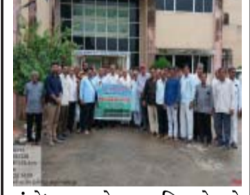
સંશોધનના તાજેતરના પરિણામો અને ઉત્પાદનક્ષમતા વધારવા માટેની પદ્ધતિઓ વિશે મહત્વપૂર્ણ માહિતી ખેડૂતોને પ્રદાન કરવામાં આવી હતી. આ તાલીમ દ્વારા ખેડૂતોને નિષ્ણાતોએ ખેડૂતોને તેલબીયાં પાકો, દાળ તથા પ્રાકૃતિક ખેતી અંગે માર્ગદર્શન આપ્યું હતું. ઉપરાંત પ્રાકૃતિક ખેતીના નવા પ્રયોગો,

(ગરવી તાકાત) મહેસાણા તા.૯ ગુજરાત પ્રાકૃતિક કૃષિ વિકાસ બોર્ડ, મહેસાણા દ્વારા ગત તા. ૦૮/૦૮/૨૦૨૫ના રોજ સરદાર કૃષિનગર દાંતીવાડા કૃષિ મહાવિદ્યાલય ખાતે મહેસાણા જિલ્લાના ખેડૂતો માટે જિલ્લા બહારની એક દિવસીય તાલીમ યોજાઈ હતી.