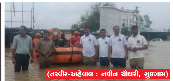
(તરવીર-અહેવાલ : નવીન ચોધરી, સુઈગામ)

(ગરવી તાકાત) સુઈગામ તા.૯ સરહદી વિસ્તારમાં સુઈગામ તાલુકામાં છેલ્લા ત્રણ દિવસથી અતિભારે વરસાદ ના કારણે કેટલા ગામો સંપર્ક વિહોણા બન્યા હતા ત્યારે સુઈગામ પીઆઈ શ્રી એચ.એમ.પટેલ અને તેમના સ્ટાફ દ્વારા સમય સૂચકતા જ જિલ્લા પોલીસ વડા પાસે બીજી વધુ પોલીસ ની મદદ માં જરૂરિયાત હોય જેથી જિલ્લા પોલીસ વડાએ તરત કાલી ભાભર પીઆઈ, દિયોદર પીઆઈ, સહિત જિલ્લા એસ.સો.જી ટીમને ફાળવીને તરત કાલી સુઈગામ