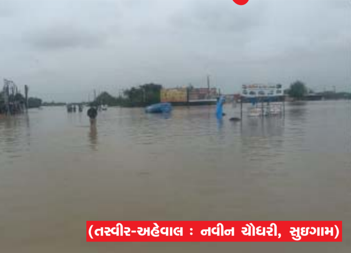
(તરવીર-અહેવાલ : નવીન ચોધરી, સુઈગામ)

નેતૃત્વમાં જિલ્લા યુ.જી.વી.સી.એલ પાલનપુર સર્કલ હેઠળ યુદ્ધના ધોરણે વીજ પુરવઠો પુનઃસ્થાપન કામગીરી ચાલી રહી