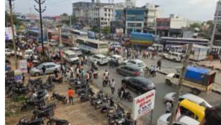
પોલીસ કર્મચારીઓને ધમકી આપી હતી. આ લોકોએ મોતીપુરા ટ્રાફિક ચોકીના કાય અને ખુરશીઓની તોડફોડ કરી અંદાજે રૂ. ૫ હજારનું નુકસાન પહોંચાડ્યું હતું. પોલીસે જિલ્લા મેજિસ્ટ્રેટના

(ગરવી તાકાત) હિંમતનગર તા.૯ હિંમતનગરના મોતીપુરામાં નિવૃત્ત સૈનિકોની રેલી દરમિયાન હિંસક બનેલા ટોળાએ ટ્રાફિક ચોકીમાં તોડફોડ કરતા ચક્રાચર મચી ગઈ છે. પોલીસે ૮૦ અજાણ્યા લોકો સામે ગુનો નોંધ્યો છે. PI એમ.ડી. ગઢવીની ફરિયાદ મુજબ, ૩ સપ્ટેમ્બરે આમી જવાન યશપાલસિંહ ઝાલા વિરુદ્ધના કેસની રજૂઆત માટે રેલીનું આયોજન કરવામાં આવ્યું હતું. આ દરમિયાન ૮૦ જેટલા લોકોએ પૂર્વ આયોજિત કાવતરા હેઠળ ગેરકાયદેસર મંડળી રચી હતી. ટોળાએ મોતીપુરા બાયપાસ રોડ પર ટ્રાફિકની અવ્યવસ્થા સર્જી હતી. તેમાંથી ૧૦ જેટલા લોકોએ