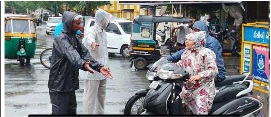
દંડને બ્રેક : હેલ્મેટના નિયમનો અમલ જનજાગૃતિથી થશે : લોકરોપનો પડઘો

અમલ થશે તેવું પોલીસે જાહેર્યું હતું. રસ્તા પર હોઈંગ બોર્ડ મુકીને સૌને નવી આદત માટે તૈયાર થવા સંદેશો આપ્યો હતો. ઉચ્ચ પોલીસ અધિકારીઓએ હેલ્મેટ સાથે રેલી પણ યોજાઈ હતી. પરંતુ આ સમયે પણ લોકો શહેરના ગીચ ટ્રાફિકમાં, ટુંકા અંતરમાં હેલ્મેટ પહેરવા તૈયાર નહીં થાય તેવું જ વાતાવરણ હતું. હેલ્મેટ પહેરવાથી સલામતી જરૂર વધતી હશે પરંતુ લોકોના પ્રશ્નો તેનાથી વધી જાય છે તેવું ભુતકાળમાં પણ સાબિત થયું છે. આ વખતે તો સ્કુટરમાં બેઠેલા બંને વ્યક્તિઓ માટે ફરજિયાત હેલ્મેટ જાહેર કરાઈ હતી. એક વ્યક્તિ પણ લાંબો સમય સતત હેલ્મેટ પહેરે તો થાકી જવાથી માંડી ગભરામણના પ્રશ્નો પણ થતા હતા. ગઈકાલે પોલીસે પ્રથમ દિવસે એવી અમલવારી કરી કે પુરા રાજકોટમાં દેકારો બોલી ગયો હતો. મોડી સાંજ સુધી લોકો ભયભીત હતા અને અનેક જગ્યાએ તો હેલ્મેટ નહીં જ પહેરે તેવું કહીને પોલીસ સાથે રકઝક કરી હતી. જાનૂત નાગરિકોએ તો કાયદો લોકો માટે હોય છે, લોકો કાયદા માટે હોતા