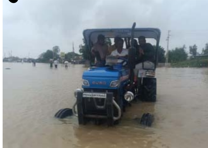
(ગરવી તાકાત) સુઈગામ તા.૯ બનાસકાંઠા જિલ્લાના સરહદી તાલુકાઓમાં છેલ્લા ત્રણ દિવસથી પવન સાથે ભારે વરસાદ નોંધાયો છે.

ખાસ કરીને સુઈગામ, ભાભર, વાવ અને થરાદ તાલુકામાં વરસાદને કારણે ગામડાઓમાં પાણી ભરાવા સાથે નાગરિકો મુશ્કેલીમાં મુકાયા હતા.