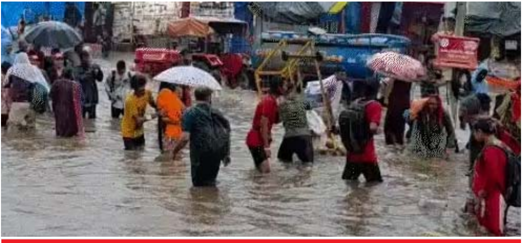
ભક્તો માટે મુશ્કેલીઓ વધારતી પરિસ્થિતિ મહા મેળામાં દર્શનાર્થે આવેલા યાત્રાળુઓને પણ ભારે મુશ્કેલીનો સામનો કરવો પડ્યો. ભક્તો વરસાદી પાણીમાં ભીંજાઈને અને કાદવમાંથી પસાર થઈને માતાજીના દર્શન માટે પહોંચતા જોવા મળ્યા.

(ગરવી તાકાત) અંબાજી તા.૭ હવામાન વિભાગની આગાહી મુજબ આજે બનાસકાંઠા જિલ્લામાં વરસાદી માહોલ જોવા મળ્યો છે. યાત્રાધામ અંબાજી અને આજુબાજુના વિસ્તારોમાં વહેલી સવારથી જ વરસાદ શરૂ થયો હતો, જે બપોર બાદ ધોધમાર વરસાદમાં ફેરવાયો હતો. હાલ અંબાજીમાં ભાદરવી પૂનમનો મહા મેળો ચાલી રહ્યો છે, જેમાં મોટી સંખ્યામાં ભક્તો માતાજીના દર્શન માટે ઉમટી રહ્યા છે. ત્યારે ભક્તિના ઘોડાપૂર વચ્ચે શ્રદ્ધાનો અખૂટ સાગરમાં ભક્તોનો પ્રવાહ જોવા મળી રહ્યો છે. ત્યારે વરસાદી માહોલમાં ઘૂંટણસમા પાણીમાં પણ અંબાજી આવી રહ્યા છે. ત્યારે જુદાજુદા આઠ દેશોમાં જોઈ લો અંબાજીના વરસાદ વચ્ચે શ્રદ્ધાનો મહાસાગર