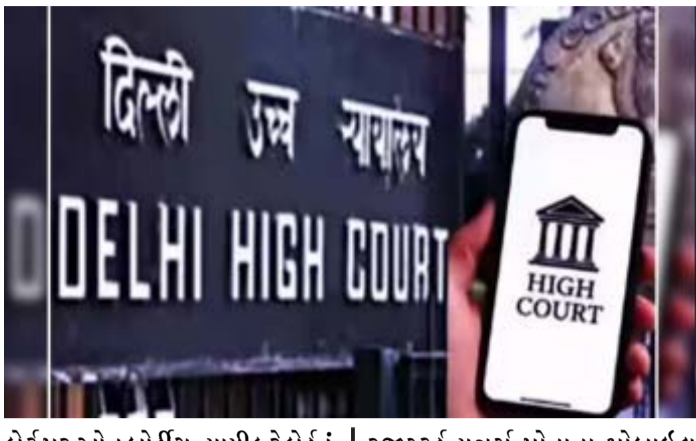
કોર્ટ પર ઓન બોર્ડિંગ ન્યાયિક રેકોર્ડનું ડિજિટલ સંરક્ષણ અને ઇ-ઓફીસનું ઉદઘાટન કરવામાં આવ્યું હતું. મોબાઈલ એપ: તેને લેટેસ્ટ ટેકનીકનો ઉપયોગ કરીને ન્યાય પ્રણાલીને વધુ સુલભ અને યુઝર ફેન્ડલી બનાવવા માટે બનાવાઈ છે. એપીલેટ ડ્રિબ્યુનલ અને જેજેબીની ઇ-

નવી દિલ્હી, તા.૭ ન્યાયિક પ્રણાલીને વધુ યુઝર ફેન્ડલી બનાવવાની દિશામાં દિલ્હી હાઈકોર્ટ ગુરુવારથી પાંચ નવી સેવાઓની શરૂઆત કરી છે. જેથી અદાલતી પ્રક્રિયાઓમાં વધુ ગતિ અને પારદર્શિતા આવવાની સાથે સાથે કાગળોની કારણ વિના બરબાદી ઘટવાનો ધાવો કરવામાં આવે છે અને ન્યાયિક પ્રક્રિયા હાઈટેક બનશે. સુપ્રિમ કોર્ટના જજ જસ્ટીસ વિક્રમ શેઠ, દિલ્હીના મુખ્યમંત્રી રેખા ગુપ્તા અને દિલ્હી હાઈકોર્ટના ચીફ જસ્ટીસ દેવેન્દ્ર કુમાર ઉપાધ્યાયની હાજરીમાં પાંચ નવી સેવાઓ દિલ્હી હાઈકોર્ટ મોબાઈલ એપ ન્યાયિક અધિકારીઓ માટે ઇ-એચઆરએમએસ પોર્ટલ એમસીડી એપીલેટ ડ્રિબ્યુનલ અને જેજેબીની ઇ-