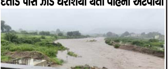
(ગરવી તાકાત) વિજયનગર તા.૭

વિજયનગર પંચક શનિવારની રાત્રી દરમિયાન ક્યાંક ઓછો તો ક્યાંક વધારે વરસાદ વરસ્યો હતો જ્યારે રવિવારની સવારે ૨ ઈંચ થી વધુ વરસાદ વરસતા સમગ્ર વિસ્તારમાં જળ બંબાકારની સ્થિતિ સર્જાઈ છે. સવારે ઉપર વાસમાં ભારે વરસાદને લઈને હાથમતિ નદી બે કાંઠે વહેતી થઈ હતી. અવિરત વરસાદ વરસવાનું ચાલુ રહેતાં જનજીવન ખોરવાયું હતું ત્યારે ચિઠોડા થી વિજયનગર તરફ દંતોડ પાસે રસ્તા પર આડ ધરાશયી થતા વાહન વ્યવહાર ખોરવાયો હતો. થરાદમાં ધોધમાર વરસાદ : મુખ્ય બજાર, બળિયા હનુમાન ચોક અને બસ સ્ટેન્ડ વિસ્તારમાં પાણી ભરાયા (ગરવી તાકાત) થરાદ તા.૭ થરાદ શહેરમાં બપોર બાદ ધોધમાર વરસાદ નોંધાયો છે. વરસાદના કારણે શહેરના અનેક વિસ્તારોમાં પાણી ભરાવાની સમસ્યા સર્જાઈ છે. મુખ્ય બજાર વિસ્તાર, બળિયા હનુમાન ચોક અને બસ સ્ટેન્ડ વિસ્તારમાં મોટા પ્રમાણમાં પાણી ભરાયા છે. શહેરના નિચાણવાળા વિસ્તારોમાં વરસાદી પાણી ભરાવાથી સ્થાનિક રહીશોની અવરજવર પ્રભાવિત થઈ છે. લોકોને ઘરની બહાર નીકળવામાં મુશ્કેલી પડી રહી છે. સ્થાનિક રહીશોએ નગરપાલિકા સામે નારાજગી વ્યક્ત કરી છે. તેમની માગણી છે કે નગરપાલિકા વરસાદી પાણીના કાયમી નિકાલની વ્યવસ્થા કરે. જેથી ભવિષ્યમાં આવી સ્થિતિ ન સર્જાય.