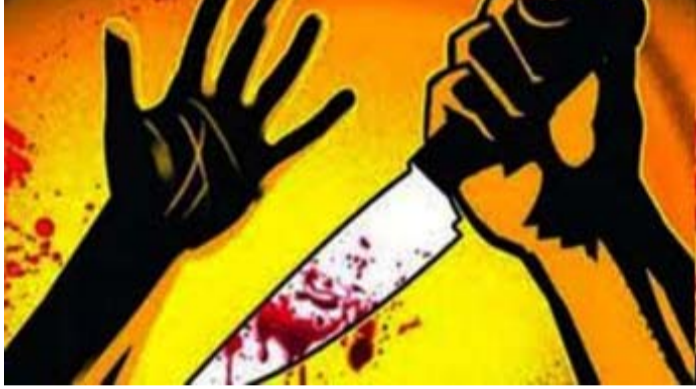
હતો. તેને તાત્કાલિક નજીકની કલાવતી સરન હોસ્પિટલમાં લઈ જવામાં આવ્યો હતો અને બાદમાં છપક હોસ્પિટલમાં રિફર કરવામાં આવ્યો હતો, જ્યાં ડોક્ટરોએ તેની છાતીમાં

નવી દિલ્હી, તા.૭ રાજધાની દિલ્હીના પહાડગંજ વિસ્તારમાં સ્કૂલની બહાર ૧૫ વર્ષના વિદ્યાર્થીને માર મારવાનો બદલો લેવા માટે છરીના ધા મારવાનો કિસ્સો સામે આવ્યો છે. પોલીસે છરીના ધા કરવાના આરોપમાં ત્રણ સગીર છોકરાઓની અટકાયત કરી છે. પકડાયેલા આ ત્રણ છોકરાઓની ઉંમર ૧૫ અને ૧૬ વર્ષની છે. પોલીસ તેમની પૂછપરછ કરીને આ મામલાની તપાસ કરી રહી છે.