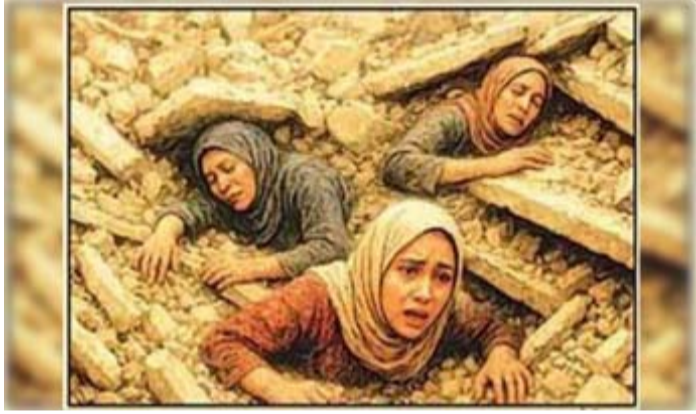
અફઘાનિસ્તાનમાં તાજેતરમાં આવેલા ભૂકંપ દરમિયાન આવા કડૂણ દર્શ્યો સર્જાયા હતા, જેમાં મહિલાઓનો જીવ ભૂકંપે નહીં પણ રૂઢિચુસ્ત તાલિબાની કાયદાઓએ લીધો હતો.

કાબુલ (અફઘાનિસ્તાન) તા.૭ રૂઢિવાદી પરંપરાઓ કેટલી ખતરનાક હોય છે તે અફઘાનિસ્તાનમાં બહાર આવ્યું છે. મધ્ય યુગમાં જીવતી અફઘાનિસ્તાનની તાલિબાની પરંપરા મુજબ પરાયા પુરૂષ મહિલાનો સ્પર્શ ન કરી શકાય અને થાય તો સજા થાય તેના કારણે ભૂકંપમાં કાટમાળમાં દબાયેલી મહિલાઓને બચાવકર્મી દળના લોકોએ મરવા માટે છોડી દેવી પડી હતી.