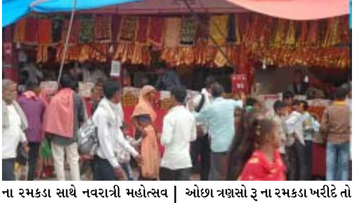
(ગરવી તાકાત) અંબાજી તા.૭

(ગરવી તાકાત) અંબાજી તા.૭ અંબાજી ભાદરવી મેળો ભક્તિ-શક્તિ સાથે નાના-મોટા વેપારીઓ માટે પણ શુકનિયાળ બની રહ્યો છે. પ્રસાદ, કંક, ચુંદડી, ધજા, રમકડાં, રેડિમેડ, માતાજીનો શ્રંગાર, ખાનપાન, ચણીયાચોળીના વેચાણ થી વેપારીઓ ની સારી કમાણી થઈ રહી છે. સાત દિવસ મા અંદાજે ૫૦ કરોડ નો વેપાર થઈ જાય છે. આનો કોઈ અધિકારીક આંકડો નથી. પણ મુખ્ય માર્ગ પર ત્રણસો જેટલા સ્ટોલ હરાજ થી ઉભા કરાયા છે. તેની હરાજી ની અપસેટ કીમત ૨૨ હજાર હતી. તેની સામે ઉંચી બોલી ર લાખ થી વધુની બોલાઈ હતી. અત્યારે અંબાજી નુ બજાર ૨૪ કલાક ધમધમે છે. મેળા દરમ્યાન સિત્તેર ટકા જેટલા વેપારી ઓ બહાર ના અને પર પ્રાંત ના જોવા મળે છે. એટલુંજ નહીં અંબાજી ના કેટલાક વેપારી ઓ પણ મેળા દરમ્યાન સાત દિવસ માટે પોતાની દુકાન બહારનાં વેપારી ઓ ને ઊંચા ભાડે આપી દે છે. તો વળી મેળામાં બાળકો