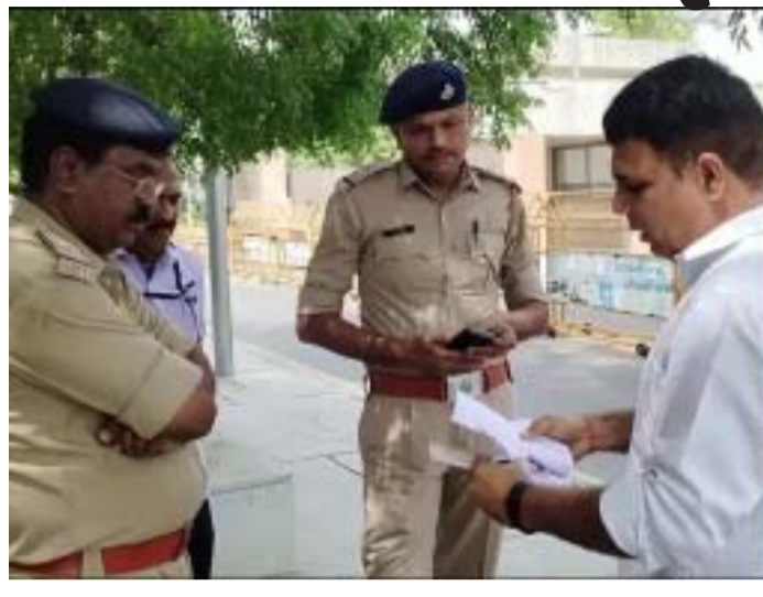
માટે ૧૦ દિવસ બાદ ૭૧ લાખનું ટેન્ડર રદ કરવામાં આવ્યું. ત્યારબાદ ૨.૮૫ કરોડનું નવું ટેન્ડર બહાર પાડવામાં આવ્યું. દરેક પોલીસ