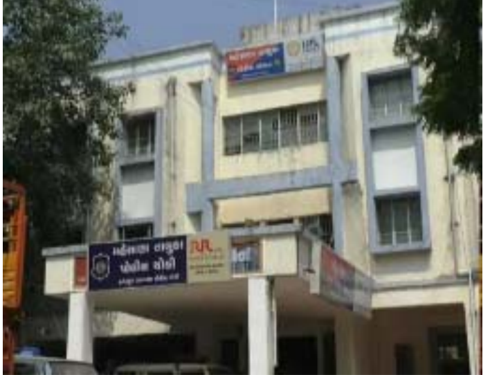
મહેસાણા બી-ડિવિઝન પોલીસ મથકે ફરિયાદ નોંધાવવામાં આવી છે. પોલીસે અજાણ્યા પશુ ચોર વિરુદ્ધ ગુનો નોંધી તપાસ શરૂ કરી છે.