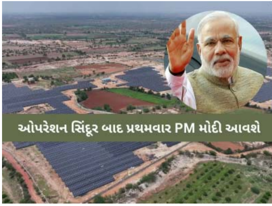
ઓપરેશન સિંદૂર બાદ પ્રથમવાર PM મોદી આવશે

લોકાર્પણ થનારા વિકાસકાર્યો જામનગરમાં ૨૨૦/૬૬ કે.વી. બાબરગર સબસ્ટેશન • જામનગરમાં ૧૩૨/૬૬ કે.વી. કાનસુમરા સબસ્ટેશન • અમરેલી, જુનાગઢ, ગીર-સોમનાથમાં ૬૬ કે.વી. HTLS ટ્રાન્સમિશન લાઇનો • મોરબીમાં ૧૧ મેગાવોટ સોલાર પીવી પ્રોજેક્ટ - જંભુડિયા વિડી • કચ્છ જિલ્લાના મંજલમાં ૧૦ મેગાવોટ સોલાર પીવી પ્રોજેક્ટ • કચ્છ જિલ્લાના લાકડિયા ખાતે ૩૫ મેગાવોટ સોલાર પીવી પ્રોજેક્ટ • જામનગર જિલ્લાના બાબરગરમાં ૨૧૦ મેગાવોટ સોલાર પીવી પ્રોજેક્ટ • કચ્છમાં લાયજા-બાડા-માપર-મોડકુબા-લહેડી-સાંધાણ-સુથરી રોડનું વિસ્તરણ અને મજબૂતીકરણ. • ભિરંડીયારા-હોડકો-ઘોરડો ટેન્ડર સિટી માર્ગનું વિસ્તરણ અને મજબૂતીકરણ • બનાસકાંઠા-સંખારી પ્રોજેક્ટ - ATC વધારવા માટે ટ્રાન્સમિશન નેટવર્ક વિસ્તાર • કંડલા ખાતે ઓઇલ જેટી નં. ૮ • કંડલામાં કાગો જેટી વિસ્તારમાં ડોમ અને ટ્રાન્સિટ સ્ટોરેજ ગોડાઉન્સ • અદિપુરથી કાગો બંધ ૧૬ અને રાષ્ટ્રીય ધોરીમાર્ગ ૧૪૧ સુધી માટે વધારાની રોડ કનેક્ટિવિટી • કંડલામાં EXIM કાગોના સ્ટોરેજ માટે પોર્ટ વિસ્તારનું વિસ્તરણ • ટ્યુના-ટેકરા ખાતે કન્ટેનર ટર્મિનલ માટે કોમલ કનેક્ટિવિટી • ગોપાલપુરીની પોર્ટ કોલોનીમાં ડી ટાઇફ ક્વર્ટર્સ • ગાંધીધામની ડી.પી.એ. પ્રથાસનિક કચેરીમાં સેન્ટર ઓફ એક્સલન્સ • માતાના મઠ ખાતે મંદિર પરિસર, ખાટલા ભવાની, ચાચર કુંડ સહિતના વિસ્તારનો વિકાસ અને સુવિધાઓ