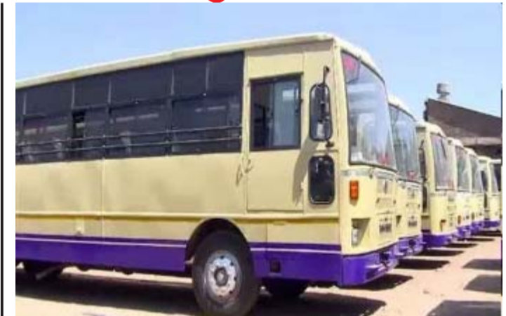
વિસનગર ૩૬૦૦માંથી ૫૦૦ બસો ફાળવવામાં આવી છે. આના કારણે રવિવારે મહેસાણા અને પાટણ જિલ્લાની લોકલ બસ સેવા પ્રભાવિત થશે. લોકલ બસ સેવા બંધ રહેવાથી ગ્રામ્ય વિસ્તારના મુસાફરોએ ખાનગી વાહનોમાં મુસાફરી કરવી પડશે. આના કારણે તેમને વધુ ભારું ચૂકવવું પડશે. રાજ્યના તમામ વિભાગોને કાર્યક્રમના સફળ આયોજન માટે અરસપરસ સંકલનમાં રહીને કામ કરવાની સૂચના આપવામાં આવી છે.

(ગરવી તાકાત) મહેસાણા તા.૨૪ વડાપ્રધાન નરેન્દ્ર મોદી ૨૬મી મેના રોજ ગુજરાતના ત્રણ શહેરોની મુલાકાતે આવી રહ્યા છે. તેમના કાર્યક્રમો માટે રાજ્યના ૧૬ એસટી વિભાગમાંથી કુલ ૩૬૦૦ બસો ફાળવવામાં આવી છે. ભુજ ખાતેના કાર્યક્રમ માટે ૧૩૦૦ બસો ફાળવવામાં આવી છે. દાહોદ ખાતેના કાર્યક્રમ માટે મહેસાણા વિભાગના ૧૨ ડેપોમાંથી ૫૦૦ બસો સહિત કુલ ૨૦૦૦ બસો ફાળવાઈ છે. વડોદરા ખાતેના કાર્યક્રમ માટે ૩૦૦ બસોની વ્યવસ્થા કરવામાં આવી છે. મહેસાણા એસટી ડિવિઝનના પાટણ, ચાણસ્મા, હારીજ, કડી, કલોલ, ખેરાલુ, મહેસાણા, બેચરાજી, ઊંજા, વડનગર, વિજાપુર અને