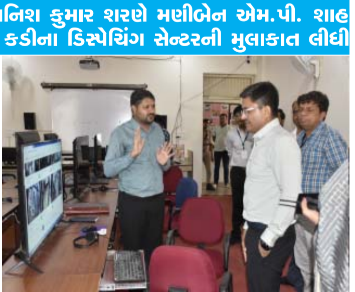
વ્યવસ્થાઓની જાત ચકાસણી કરી જનરલ ઓબ્જર્વરશ્રીએ સંતોષ વ્યક્ત કર્યો હતો. આ ઉપરાંત જનરલ ઓબ્જર્વરશ્રીએ વેબકાસ્ટીંગ અને કંટ્રોલરૂમની પણ મુલાકાત લીધી હતી અને ચૂંટણી તંત્ર દ્વારા કરવામાં

(ગરવી તાકાત) મહેસાણા તા. ૧૮ ૨૪-કડી(અ.જા) વિધાનસભા પેટા ચૂંટણી અંતર્ગત તા. ૧૯ જુનના રોજ મતદાન યોજનાર છે. જિલ્લા ચૂંટણી અધિકારી અને કલેક્ટરશ્રી એસ. કે. પ્રજાપતિના માર્ગદર્શન હેઠળ જિલ્લા ચૂંટણી તંત્ર દ્વારા તમામ આગોતરી તૈયારીઓ પૂર્ણ કરી દેવામાં આવી છે. જે અંતર્ગત આજરોજ જનરલ ઓબ્જર્વરશ્રી અવનિશ કુમાર શરણે મહીબેન એમ. પી. શાહ મહિલા આર્ટસ કોલેજ કડી ખાતેના ડિસ્પેચિંગ સેન્ટરની મુલાકાત લીધી હતી. જનરલ ઓબ્જર્વરશ્રીએ ડિસ્પેચિંગ સેન્ટર ખાતે ચાલી રહેલ સમગ્ર ચૂંટણી કામગીરીનું નિરીક્ષણ કર્યું હતું. વધુમાં ડિસ્પેચિંગ સેન્ટર ખાતે કરવામાં આવેલ તમામ