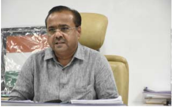
ઓળખ માટે ભારતના ચૂંટણીપંચ દ્વારા જારી કરવામાં આવેલ અન્ય ૧૨ ડોક્યુમેન્ટ્સને જ આધારભૂત પુરાવા તરીકે સ્વીકારવામાં આવશે આ પુરાવા દ્વારા મતદારો મતદાન કરી શકશે. મતદાન મથકની અંદર મોબાઇલ સાથે પ્રવેશ નિષેધ છે. પરંતુ ભારતના ચૂંટણીપંચની નવિન સૂચના અને નવી પહેલ અંતર્ગત મતદાન મથકના ૧૦૦ મીટરના વિસ્તારમાં ફક્ત મોબાઇલ ફોન લઈ જઈ શકાશે અને તે ફરજિયાતપણે 'સ્વીચ ઓફ મોડ' માં રાખવાનો રહેશે. મતદાન મથકના પ્રવેશદ્વાર પર ૧૦ જેટલા

કડી(અ.જા) વિધાનસભા મતવિભાગ પેટા ચૂંટણી-૨૦૨૫ માટે મતદાન મથકો ખાતે Assured Mininum Facilities (AMF) જેવી કે, પીવાનું પાણી, શેડ, ટોઈલેટ તથા દિવ્યાંગ મતદારો માટે રેમ્પની સુવિધા ઉપલબ્ધ છે. તમામ ૨૯૪ મતદાન મથક સ્થળો ઉપર મતદાનના દિવસે વહીવટીની વ્યવસ્થા ઉપલબ્ધ કરવામાં આવેલ છે અને તમામ મતદાન મથકો ઉપર વેબ-કાસ્ટીંગ કરવામાં આવશે. આ ઉપરાંત CAPF, વિડીયોગ્રાફી, માર્કીંગ ઓબ્જર્વર વિગેરેની નિયત મતદાન મથકો પર વ્યવસ્થા કરવામાં આવેલ છે. વધુમાં તેમણે ઉમેર્યું હતું કે મતદાન માટે ચૂંટણીકાર્ડને મુખ્ય પુરાવો ગણાશે. આ સિવાય મતદારની