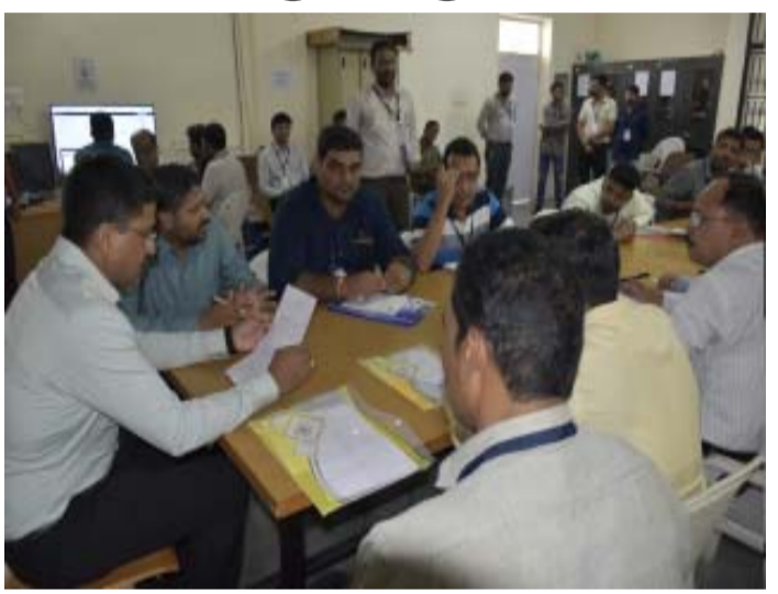
જનરલ ઓબ્જર્વર ડિસ્પેચિંગ સેન્ટર ખાતે ચાલી રહેલ સમગ્ર ચૂંટણી કામગીરીનું નિરીક્ષણ કર્યું