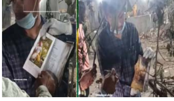
પવિત્ર ગ્રંથ સાથે અમદાવાદથી લંડન જઈ રહ્યો હતો. જ્યાં બધો સામાન બળીને રાખ થઈ ગયો હતો, ત્યાં ભગવદ ગીતા સંપૂર્ણપણે સુરક્ષિત અને વાંચી શકાય તેવી સ્થિતિમાં હતી. ત્યાં હાજર લોકો તેમને ચમત્કાર તરીકે જોઈ રહ્યા છે. સોશિયલ મીડિયા પર વાયરલ છે.

અમદાવાદ, તા. ૧૩ ૧૨ જૂનના ૨૦૨૫ રોજ બપોરે અમદાવાદમાં એર ઈન્ડિયાના વિમાનના ભયાનક ક્રેશ બાદ બચાવ કામગીરી લગભગ પૂર્ણ થઈ ગઈ છે. આ અકસ્માતમાં ૨૪૧ લોકોએ જીવ ગુમાવ્યા હતા, બચાવ કામગીરી દરમિયાન વિસ્ફોટ પછી લાગેલી આગની જવાળાઓએ વિમાન અને આસપાસની વસ્તુઓને કેટલું નુકસાન પહોંચાડ્યું હતું તે સ્પષ્ટપણે જોઈ શકાય છે.