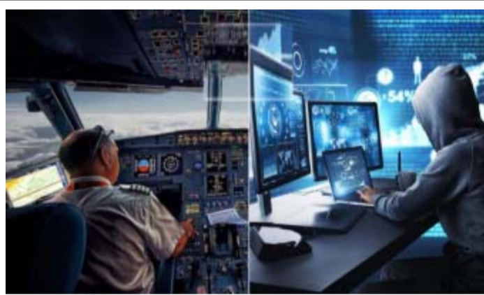
નથી. આજની એરલાઈન્સ અને વિમાન ઉત્પાદકો તેમની સિસ્ટમ્સમાં મલ્ટી લેયર સાયબર સિક્યોરિટી ટેકનીકનો ઉપયોગ કરે છે. ડેટા અને કોમ્યુનિકેશન એક્ટિવિટી સાથે સંપૂર્ણપણે સુરક્ષિત રહે છે. ફાયરવોલ્સ અને ઈન્જીન ડિટેક્શન સિસ્ટમ્સ તરત જ કોઈપણ અનધિકૃત એક્સેસ શોધી કાઢે છે.

અમદાવાદ, તા. ૧૩ અમદાવાદમાં એર ઈન્ડિયાના વિમાન દુર્ઘટના બાદ બધા આઘાતમાં છે. બોઈંગનું આ પહેલું ગ્રીમલાઈનર વિમાન છે જે ક્રેશ થયું છે. બોઈંગ ૭૩૭, બોઈંગ ૭૭૭, એરબસ ૭૩૭૦ વગેરે જેવા આધુનિક પેસેન્જર વિમાનો એવિઓનિક્સ તરીકે ઓળખાતી અત્યાધુનિક કમ્પ્યુટર સિસ્ટમ્સ દ્વારા સંચાલિત થાય છે.