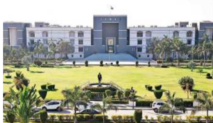
આ પ્રકારના પ્રોજેક્ટમાં સમય જ સૌથી મહત્વનો હોય છે અને તેમાં વિલંબથી સમગ્ર પ્રોજેક્ટ ખર્ચ વધી જાય છે અને કાનૂની પ્રક્રિયા પણ વધે છે. થોડા લઘુમતીમાં રહેલા સભ્યોની આ પ્રકારની પ્રવૃત્તિ સ્વીકાર્ય બને નહી તેવું જણાવીને હાઈકોર્ટે આ અરજી કરનાર અમદાવાદની જોધપુર સ્થિત વિવેકાનંદ વગર સો સાયટીના રહીશોમાં જેઓ વિરોધ કરતા હતા.

(ગરવી તાકાત) અમદાવાદ તા. ૨૮ ગુજરાતમાં ત્રણ થી ચાર દશકા જૂની ઈમારતોના રીડેવલપમેન્ટ માટેની પ્રક્રિયા અંગે એક મહત્વપૂર્ણ ચૂકાદામાં સો સાયટીના રીડેવલપમેન્ટમાં કાનૂની મુદ્દાઓ પર વિધાનો ઉભા કરનાર સામે આકરી ટીકા સાથે તેઓની કથદેખટ ઓફ કોર્ટની અરજ ફગાવીને આકરો દંડ કર્યો હતો. રીડેવલપમેન્ટમાં ફક્ત થોડા સભ્યો દ્વારા સમગ્ર પ્રક્રિયામાં કોઈને કોઈ વિધાન ઉભા કરીને બહુમતી સભ્યોના હિતોને જે રીતે રોકવા માટે જે પ્રયાસો થયા છે. તે સંદર્ભમાં આ ચૂકાદો અત્યંત મહત્વનો બની જાય છે.