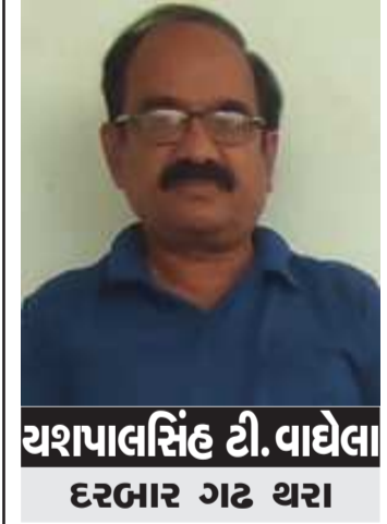
યશપાલસિંહ ડી. વાઘેલા દરબાર ગઠ થરા

ભક્તિમાર્ગમાં ભેદનો નાશ કરી અભેદ સિદ્ધ કરવામાં આવે છે. ભક્ત ભક્તિથી ભેદને નાશ કરી શ્રીકૃષ્ણ સાથે એક બને છે. રાસલીલા ભાગવતનું સુખ્ય ફળ છે. પ્રથમ પૂતના એટલે વાસનાનો ક્ષય થાય છે, પછી તુષ્ટાવર્તનો નાશ થાય છે, એટલે રજોગુણનો નાશ થાય છે અને જીવનમાં ખૂબ સાત્ત્વિકતા આવે છે. આમ જોકે એક એક ઈન્દ્રિયને ભક્તિરસથી પુષ્ટિ મળે છે. છેવટે દાવાગ્નિ શાંત થાય છે ત્યારે વેણુગીત સંભળાય છે. આ બધી રાસમાં જવાની તૈયારી છે. ઈશ્વરનું પ્રત્યક્ષ સ્વરૂપ નાદબ્રહ્મમાં તનમ્યતા સિદ્ધ થાય એટલે પરબ્રહ્મ મળે છે. વેણુ ગીતમાં બ્રહ્માચારિણી ગોપીઓ સાથે રાસ છે. યજ્ઞ પત્નીઓના પ્રસંગમાં વિવાહિતા ગોપીઓ સાથે રાસ છે ગોવર્ધન લીલામાં વાનપ્રસ્થ ગોપીઓ સાથે થયે. એક વખત ગોપ બાળકોને કહ્યું, કનૈયા, અમને ભૂખ લાગી છે. કનૈયાએ ગોપ બાળકોને બ્રાહ્મણો યજ્ઞ કરતા હતા ત્યાં મોંકદયા, પણ બ્રાહ્મણોએ કંઈ ખાવા ન આપ્યું, પણ બ્રાહ્મણોની પત્નીઓ કનૈયા ને ઓળખતી હતી. તેઓ ભોજન સામગ્રી લઈ આવી પ્રભુએ એ યજ્ઞ પત્નીઓનો