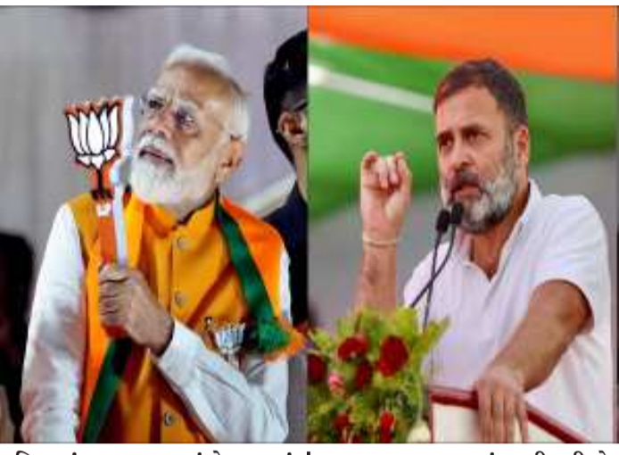
મહિનામાં પ્રથમ સમાહમાં બે પ્રવાસનું આયોજન થઈ રહ્યું છે. એટલે કે પ્રધાનમંત્રી નરેન્દ્ર મોદી માર્ચ મહિનામાં બે વાર ગુજરાત પ્રવાસે આવી રહ્યા છે. હાલ પ્રધાનમંત્રી મોદીના પ્રવાસની તડામાર તૈયારી

આવવાનો છે. ગુજરાતમાં આગામી દિવસોમાં જાણે રાજકીય મેળાવડો જામવાનો હોય, ભાજપ અને કોંગ્રેસના નેતાઓ દિલ્હીથી ગુજરાતમાં ધામા નાંખશે. ત્યારે હવે જેવું રહ્યું કે, ગુજરાતની ભૂમિ પરથી હવે કેવું રણશીંગું ફૂંકવાનું છે. બિહાર અને પશ્ચિમ બંગાળની ચૂંટણી આવી રહી છે, ત્યારે તેના લેખાજોખા ગુજરાતથી થશે તેવું લાગી રહ્યું છે. બીજી તરફ, કોંગ્રેસની રણનીતિ પણ સાવ નવી છે. સ્થાનિક સ્વરાજ્યની ચૂંટણીમાં હાર બાદ કોંગ્રેસ ૩૫૯ જોશમાં હોય તેવું લાગી રહ્યું છે. હાલ પાર્ટી ગુજરાતમાં રાષ્ટ્રીય અધિવેશનની તૈયારી કરી રહી છે. હાલ વિધાનસભાનું બજેટ સત્ર ચાલી રહ્યું છે. માર્ચ મહિનામાં પ્રધાનમંત્રી નરેન્દ્ર મોદીના માર્ચ