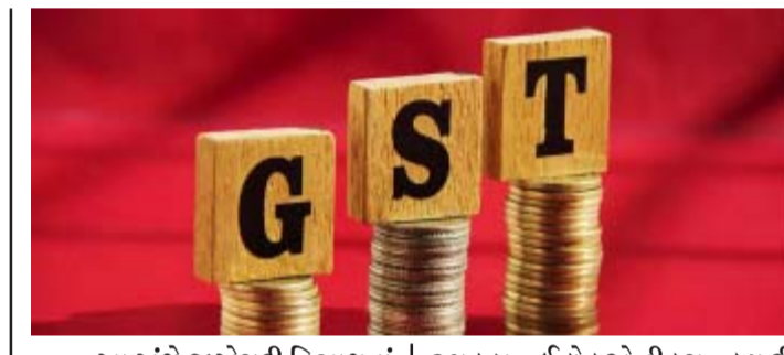
આ અંગે જીએસટી વિભાગનાં જણાવ્યા મુજબ કરચોરી એટલે કે અટકાવવા માટે ગુજરાત સ્ટેટ જીએસટી વિભાગ દ્વારા તાજેતરમાં કેમિકલ્સ, ગીફ્ટ આર્ટીકલ્સ, અને રમકડા, ઇલેક્ટ્રોનિક્સ, બ્યુટી પાર્લર, અને મેન પાવર સહિત વિવિધ ક્ષેત્રોમાં કાર્યરત કુલ ૧૪ વેપારીઓને ત્યાં દરોડા પાડવામાં આવેલ હતાં.

(ગરવી તાકાત) ગાંધીનગર તા.૩૦ સ્ટેટ જીએસટી વિભાગની એન્ફોર્સમેન્ટ વિંગએ કેમિકલ્સ, રમકડા, ગિફ્ટ આર્ટીકલ્સ, ઇલેક્ટ્રોનિક્સ, બ્યુટીપાર્લર અને મેન પાવરનાં ૧૪ વેપારીઓને ત્યાં હાલમાં જ દરોડા પાડ્યા હતા. અને તપાસનાં અંતે તંત્રએ કુલ રૂ.૯.૧૧ કરોડની કરચોરી ઝડપી લીધી છે. જી. એ સ. ટી. તંત્રે અમદાવાદ, સુરત, વાપી અને વ્યારાનાં વેપારીઓને ત્યાં દરોડા પાડી કરચોરી અંગે તપાસો હાથ ધરી હતી. આ અંગે જીએસટી વિભાગનાં જણાવ્યા મુજબ કરચોરી એટલે કે અટકાવવા માટે ગુજરાત સ્ટેટ જીએસટી વિભાગ દ્વારા તાજેતરમાં કેમિકલ્સ, ગીફ્ટ આર્ટીકલ્સ, અને રમકડા, ઇલેક્ટ્રોનિક્સ, બ્યુટી પાર્લર, અને મેન પાવર સહિત વિવિધ ક્ષેત્રોમાં કાર્યરત કુલ ૧૪ વેપારીઓને ત્યાં દરોડા પાડવામાં આવેલ હતાં. ૧૪ વેપારીઓ પૈકી ૮ વેપારીઓ અમદાવાદમાં ૩, વેપારીઓ સુરતમાં ૨ વેપારીઓ વાપીમાં તથા ૧ વેપારી વ્યારામાં આવેલ હતાં. તપાસ દરમિયાન બિનલિસાબી વેચાણ અને વેરાની ઓછી જવાબદારી દર્શાવવા જેવી ગેરરીતિઓ ધ્યાનમાં આવેલ હતી. અને અંદાજીત રૂ.૯.૧૧ કરોડની કરચોરી શોધી કાઢવામાં આવી હતી. રાજ્ય કર વિભાગ દ્વારા આ કેસમાં સરકારી આવકના રક્ષણ અને વસુલાત માટે યોગ્ય કાયદાકીય કાર્યવાહી હાથ ધરવામાં આવેલ છે.