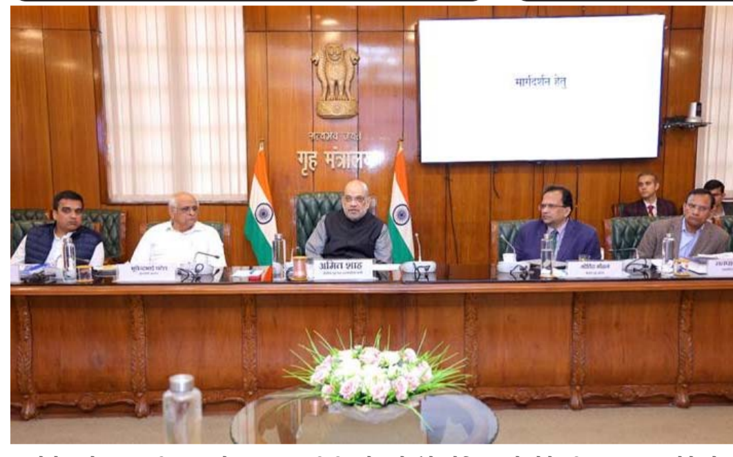
કહ્યું કે તેના યોગ્ય અમલીકરણ માટે, રાજ્યના ગૃહ અને આરોગ્ય વિભાગે એક બેઠક યોજાવી જોઈએ અને હોસ્પિટલોમાંથી પોસ્ટમોર્ટમ અને અન્ય તબીબી અહેવાલો ઇલેક્ટ્રોનિક રીતે પ્રાપ્ત કરવા પર ભાર મૂકવો જોઈએ. શ્રી શાહે કહ્યું કે જેલ, સરકારી હોસ્પિટલો, બેંકો, ફોરેન્સિક સાયન્સ લેબોરેટરી (FSL) વગેરે જેવા પરિસરમાં વીડિયો કોન્ફરન્સિંગ દ્વારા પુરાવા રેકોર્ડ કરવાની વ્યવસ્થા હોવી જોઈએ. તેમણે કહ્યું કે જેલોમાં દરેક કોર્ટ માટે વિડીયો કોન્ફરન્સિંગ ક્યુબિકલ હોવું જોઈએ. કેન્દ્રીય ગૃહ અને સહકારિતા મંત્રીએ કહ્યું કે પોલીસે ઇલેક્ટ્રોનિક ડેશબોર્ડ પર પૂછપરછ માટે અટકાયતમાં લેવાયેલા લોકો વિશેની માહિતી, જમી યાદી અને કોર્ટમાં મોકલવામાં આવેલા કેસોની માહિતી પ્રદાન કરવી જોઈએ. તેમણે રાજ્યના પોલીસ મહાનિર્દેશકને આ કેસોનું સતત નિરીક્ષણ કરવાનો નિર્દેશ પણ આપ્યો. શ્રી શાહે પોલીસ સ્ટેશનોમાં નેટવર્ક કનેક્ટિવિટી સ્પીડ નિર્ધારિત ધોરણો કરતાં ૩૦ mbps વધુ વધારવા જણાવ્યું. શ્રી અમિત શાહે કહ્યું કે રાજ્ય સરકારે એક પરિપત્ર બહાર પાડવો જોઈએ જેથી ખાતરી કરી શકાય કે સંગઠિત અપરાધ, આતંકવાદ અને મોબ લિથિંગની જોગવાઈઓનો નોંધ રુપયોગ ન થાય. આ માટે ઉચ્ચ સ્તરે

(ગરવી તાકાત) મહેસાણા તા. ૩૦ કેન્દ્રીય ગૃહ અને સહકારિતા મંત્રી શ્રી અમિત શાહે આજે નવી દિલ્હીમાં ગુજરાતના મુખ્યમંત્રી શ્રી ભૂપેન્દ્ર પટેલની હાજરીમાં રાજ્યમાં ગ્રામ નવા ફોજદારી કાયદાઓના અમલીકરણ અંગે સમીક્ષા બેઠકની અધ્યક્ષતા કરી હતી. આ બેઠકમાં ગુજરાતમાં પોલીસ, જેલ, અદાલત, ફરિયાદ અને ફોરેન્સિક સંબંધિત વિવિધ નવી જોગવાઈઓના અમલીકરણ અને વર્તમાન સ્થિતિની સમીક્ષા કરવામાં આવી હતી. આ બેઠકમાં ગુજરાતના ગૃહ રાજ્યમંત્રી, કેન્દ્રીય ગૃહ સચિવ, મુખ્ય સચિવ અને ગુજરાતના પોલીસ મહાનિર્દેશક, રાષ્ટ્રીય ગુના રેકોર્ડ બ્યુરો (NCRB)ના મહાનિર્દેશક અને કેન્દ્રીય ગૃહ મંત્રાલય અને રાજ્ય સરકારના અનેક અધિકારીઓ હાજર રહ્યા હતા. બેઠકમાં ચર્ચા દરમિયાન, કેન્દ્રીય ગૃહ અને સહકારિતા મંત્રીએ જણાવ્યું હતું કે પ્રધાનમંત્રી શ્રી નરેન્દ્ર મોદીજી દ્વારા લાવવામાં આવેલા ગ્રામ નવા ફોજદારી કાયદાઓનો આત્મા ગ્રામ વર્ષમાં FIR થી સુપ્રીમ કોર્ટ સુધીના કોઈપણ કેસમાં ન્યાય આપવાની જોગવાઈમાં છે. નવા ફોજદારી કાયદાઓના અમલીકરણમાં ગુજરાત સરકાર દ્વારા અત્યાર સુધી કરવામાં આવેલા કાર્યની પ્રશંસા કરતા, શ્રી શાહે રાજ્ય સરકારને ૩૦ એપ્રિલ, ૨૦૨૫ સુધીમાં તમામ ક્રમિશનરેટમાં નવા કાયદાઓનો ૧૦૦ ટકા અમલ સુનિશ્ચિત કરવા જણાવ્યું. તેમણે કહ્યું કે ગુજરાતના મુખ્યમંત્રી દ્વારા માસિક, રાજ્યના ગૃહ મંત્રી દ્વારા પખવાડિયામાં અને મુખ્ય સચિવ, અધિક મુખ્ય સચિવ (ગૃહ) અને પોલીસ મહાનિર્દેશકના સ્તરે