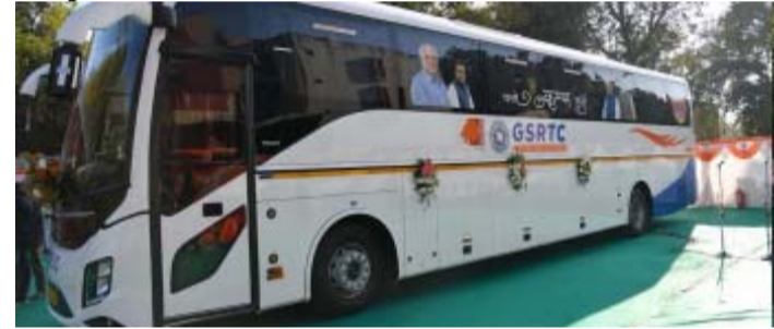
બસો શરૂ કરવા માટે સરકારમાં દરખાસ્ત કરી છે.કુંભ માટે બસો ચાલુ કરવા મંજૂરી માંગી છે. ત્યારે આ અંગે એકાદ બે દિવસ બાદ કોઈ નિર્ણય લેવાય તેવા નિર્દેશો એસ.ટી. નિગમના એમ.ડી. અનુપમ આનંદે એક વાતચિત દરમિયાન આપેલ હતો. તેઓ એ જણાવેલ હતું કે, હાલમાં જ કુંભમાં જે દુર્ઘટના ઘટી છે. તે બાદની હાલની સ્થિતિનો તાગ મેળવાઈ રહ્યો છે. અને રાજકોટ, સુરત, તથા વડોદરાથી પણ કુંભમાં જવા માટે વોલ્વો શરૂ કરવા સરકાર હકારાત્મક છે. ત્યારે આ બાબતે એકાદ-બે દિવસમાં જ બસો અંગે નિર્ણય લેવાય તેવી શક્યતા છે.

(ગરવી તાકાત) અમદાવાદ તા.૩૦ તાજેતરમાં જ રાજ્ય સરકાર દ્વારા પવિત્ર મહાકુંભમાં લોકો સરળતાથી અને સસ્તા દરે જઈ શકે તે માટે એસ.ટી. નિગમની 'વોલ્વો' બસો શરૂ કરવામાં આવી છે. ખાસ રૂ.૮૧૦૦નાં પેકેજ સાથેની આ બસોનું એક માસનું બુકીંગ ૨૪ કલાકમાં જ થઈ ગયું હતું. દરમિયાન આ પ્રકારની વોલ્વો બસો રાજકોટ, સુરત અને વડોદરાથી પણ શરૂ કરવા માટે વ્યાપક ડિમાન્ડ અને ઈકવાયરી થઈ રહી છે. જેનાં પગલે એસ.ટી. નિગમનાં સત્તાવાળાઓએ રાજકોટ, સુરત અને વડોદરાથી પણ એસ.ટી.ની વોલ્વો