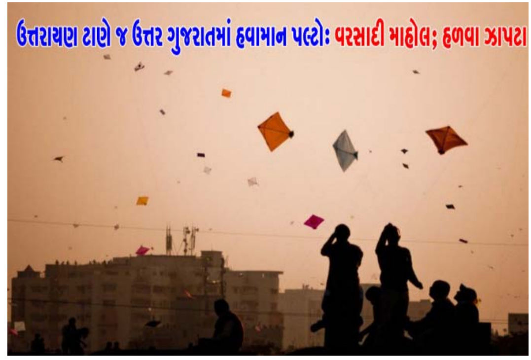
ઉત્તરાયણ ટાણે જ ઉત્તર ગુજરાતમાં હવામાન પલ્ટો: વરસાદી માહોલ; હળવા ઝાપટા

હતા. બનાસકાંઠા જિલ્લાના કેટલાંક વિસ્તારોમાં વરસાદી માહોલ સર્જાયો હતો. પાલનપુરના જગાણા, ભાગળ સહિતના ગ્રામ્ય વિસ્તારોમાં હળવા ઝાપટા-છાંટા વરસ્યા હતા. કામો સમી વરસાદથી ખેડૂતો ચિંતામાં મુકાયા હતા. તુવેર સહિતના શિયાળુ પાકની નિકળતી સીઝનમાં વધુ વરસાદ નુકશાન કરી શકે છે. બનાસકાંઠા પંથકમાં વરસાદી માહોલ છતાં હવામાન વિભાગે કમોસમી વરસાદની કોઈ આગાહી કરી નથી અને આવતા સાત દિવસ સુધી હવામાન શુષ્ક રહેવાની શક્યતા દર્શાવી છે. અમુક હવામાન નિષ્ણાંતોએ માવઠાની સંભાવના દર્શાવી હોવાથી મકરસંક્રાંતિ ટાણે પતંગ રસિયાઓના જીવ ઉચ્ચક થયા છે.