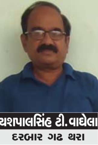
યશપાલસિંહ ડી. વાઘેલા દરબાર ગઠ યરા

વિષમતા નથી. પ્રકૃતિના ત્રણ ગુણો છે: સત્વગુણ, રજોગુણ તથા તમો ગુણ. આત્માના નથી. પરમેશ્વર જીવના ભોગ માટે ઈચ્છે છે, ત્યારે રજો ગુણનાં બળમાં વૃદ્ધિ કરે છે. જીવો ના પાલન માટે ઈચ્છે છે ત્યારે સત્વગુણના બળમાં વૃદ્ધિ કરે છે અને સંહાર કરવા ઈચ્છે છે, ત્યારે તમોગુણના બળમાં વૃદ્ધિ કરે છે. રાજસ્ય યજ્ઞમાં પહેલી પૂજા શ્રીકૃષ્ણની કરવામાં આવી. પણ તે સહન ન થવાથી શિશુપાલ ભગવાનની નિંદા કરવા લાગ્યો. ભગવાને નિંદા સહન કરી પણ છેવટે તેનો વધ કર્યો. શિશુપાલના શરીરમાંથી નીકળેલું આત્મતેજ દ્વારિકાધીશ માં લીન થયું અને તેને સદગતિ મળી. આ કોઈ યુધિષ્ઠિરને આશ્ચર્ય થયું. તેથી તેણે નારદજીને પૂછ્યું કે, શિશુપાલ તો ભગવાનનો શત્રુ હતો, જતાં એને સદગતિ કેમ મળી? તે નરકમાં કેમ