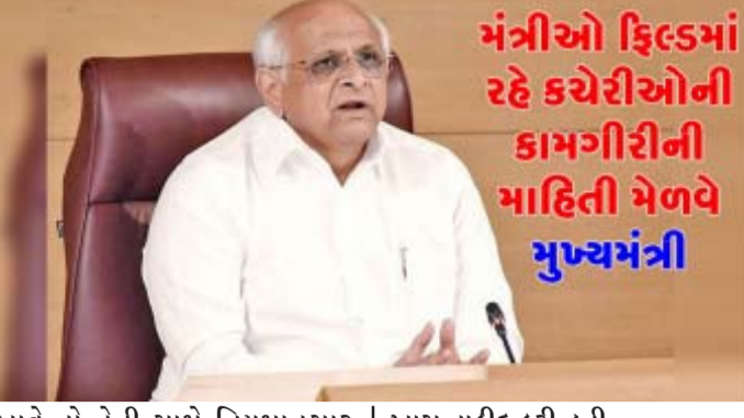
મંત્રીઓ ફિલ્ડમાં રહે કચેરીઓની કામગીરીની માહિતી મેળવે મુખ્યમંત્રી

ગુજરાતમાં હવે વિધાનસભાના બજેટ સત્ર બાદ સ્થાનિક સ્વરાજની સંસ્થાઓની ચુંટણીઓ યોજાશે તે નિશ્ચિત બન્યા બાદ રાજ્ય સરકારના બજેટમાં પણ તેનું પ્રતિબંધ પડશે. તે સમયે મુખ્યમંત્રીએ તમામ મંત્રીઓને સમાહમાં ત્રણથી ચાર દિવસ ફિલ્ડમાં રહીને તેમના હેડળીના વિભાગોનો સરકારી કચેરીઓની 'સરપ્રાઈઝ' વિઝીટ લઈને તંત્રની કામગીરી સુધરે તે જોવા અને તેમના મંત્રાલયના બજેટનો પણ પુરો અને જે હેતુથી ફાળવણી થઈ છે તે ખાસ જોવા તાકીદ કરી છે.