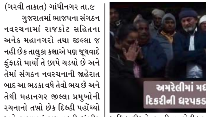
અમરેલીમાં મધરાત્રીના પાર્ટીદાર દિકરીની ધરપકડથી મુખ્યમંત્રી નારાજ

એક વખત મધરાત્રીના ધરપકડના વિવાદ છતા પોલીસે કોની સૂચનાથી ફરી એ જ પાર્ટીદાર દિકરીને મેડીકલ હેતુ પર રાત્રીના ઉઠાવી! કોણ 'લડી' લેવા માંગે છે! ચર્ચા