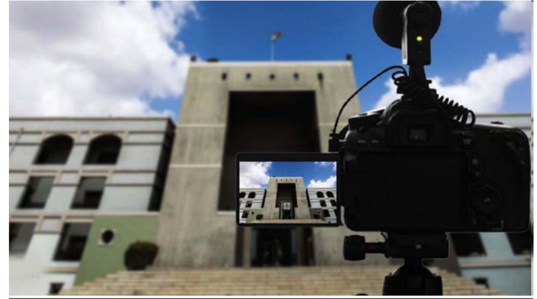
તાલીમથી તમામ મદદનીશ સરકારી વકીલોને આ ગ્રાહ નવા ફોજદારી કાયદા અંગે વિગતવાર માહિતી મળશે, જેથી અદાલતમાં ઝડપથી કેસ કેવી રીતે ચાલે તે માટે તૈયાર થઈ શકશે