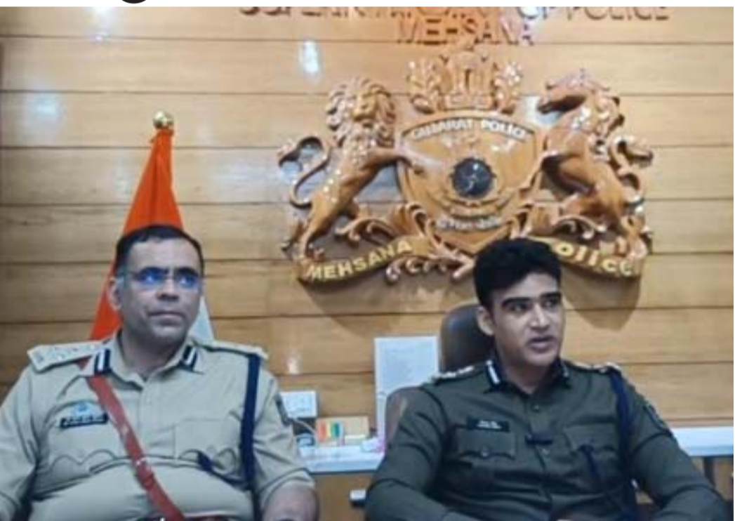
મહેસાણા જિલ્લામાં રેતી, કપચી ભરી હાઈવે ઉપર બેફામ દોડતાં ડમ્પરો સામે કાર્યવાહી કરવા માંગ

તમામ અધિકારીઓને સૂચના આપવામાં આવી છે. આનો એક પ્લાન બનાવી અલગ અલગ જગ્યા પર સમસ્યા છે, ત્યાં પ્લાન બનાવીને આના પર કાર્યવાહી થાય એવું આયોજન કરવામાં આવશે. આના સિવાય પોલીસની કાર્યમ કોન્ફરન્સ લેવામાં આવી છે, જેમાં ડિટેક્શન ના થયા હોય એમ સુધારો કરવા સૂચના અપાઈ ફેટલના કેસ ઓછા થયા છે. એનડીપીએસના કેસ સારા કરવામાં આવ્યા છે. એક રજૂઆત રજૂ થઈ છે જેમાં અમુક ડમ્પરમાં જે રેતી કપચી ભરેલી હોઈ આ રોડ પર બહાર પડતી હોઈ છે ને ઊડતી હોઈ છે, આનાથી સમસ્યા ઉભી થઈ શકે છે. આ બાબતે ડીવાયએસપી લેવલ પર તમામ જે ડમ્પરવાળા લોકો છે એમના એસોસિએશન સાથે મિટિંગ થશે અને તમામને સૂચના આપવામાં આવશે જેમાં ડમ્પરો ઢાંકીને રાખે જેથી રેતી કપચી એમાંથી રોડ પર ના પડે અને કોઈ પાલન નહિ કરે તો એના સામે કાર્યવાહી કરવામાં આવશે.