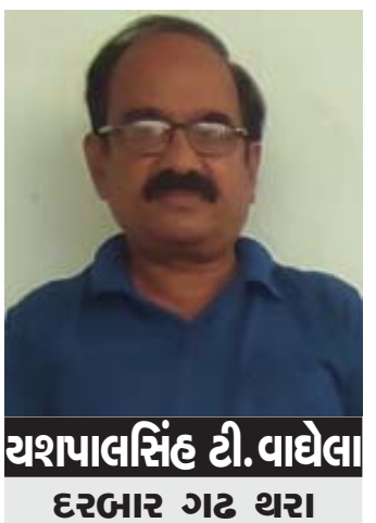
યશપાલસિંહ ડી. વાઘેલા દરબાર ગઢ થરા

કરવો અને એક પરમાત્મા ઉપર પ્રેમ કરવો. સર્વ સાથે પ્રેમ કરો અથવા સર્વનો ત્યાગ કરો. સર્વનો ત્યાગ તમારાથી ન થઈ શકે તો સર્વમાં ઈશ્વરનો ભાવ રાખી તેની સાથે પ્રેમ કરો. સર્વમાંથી મમતાનો ત્યાગ કરો અથવા સઘળું ઈશ્વરને અર્પણ કરી સર્વ કર્મકળનો ત્યાગ કરો. દરેકમાં મમતા-મારાપણું એ સમર્પણ માર્ગ. અમુકમાં જ મમતા એ સ્વાર્થ માર્ગ. આજે આ બધાં સ્વાર્થમાર્ગો બન્યા છે.