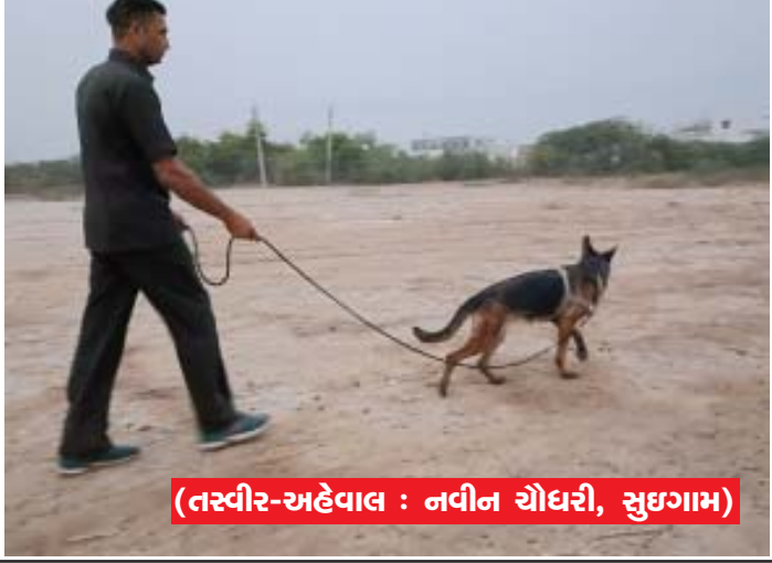
(તસ્વીર-અહેવાલ : નવીન ચૌધરી, સુઈગામ)