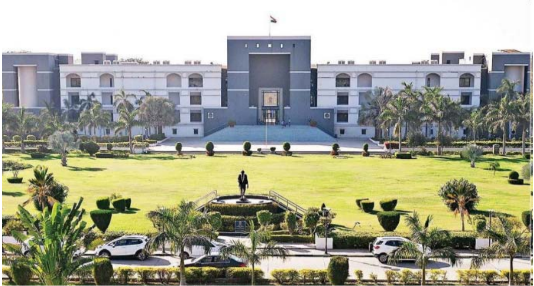
થવાની શક્યતા છે. જો કે, તેની પત્નીની નાનપણની એક બહેનપણી કે જેની સાથે તેનો ગાઢ ઘરોબો હતો અને આ બહેનપણીને પણ અરજદારની પત્ની જીવી રહ્યા હતા અને તેની પત્નીને સાત મહિનાની પ્રેગનન્સી પણ રહી છે. ફેબ્રુઆરી-૨૦૨૪માં તેને ડિલીવરી

અમદાવાદ, તા. ૨૭ પતિએ લેસ્થિબયન કોર્પસ અરજી કરીને અને પત્નીની બહેનપણી ઉપર આક્ષેપ કર્યા હતા કે બહેનપણી સાથે લેસ્થિબયન સંબંધોના દબાણમાં, સાત મહિનાનો ગર્ભ ધરાવતી પોતાની પત્ની ચાલી ગઈ છે. અરજીની સુનાવણીમાં પોલીસે અરજદારની પત્નીને શોધીને ગુજરાત હાઈકોર્ટ સમક્ષ રજૂ કરી હતી. જો કે, ગર્ભવતી સૌના આશ્ચર્ય વચ્ચે ચોંકાવનારો ઘટસ્ફોટ કર્યો હતો કે, તે પુષ્પ છે અને તે તેના પતિ સાથે જવા નથી માંગતી અને હાઈકોર્ટ પણ પત્નીને તેની સહેલી સાથે જવાની મંજૂરી આપી હતી.