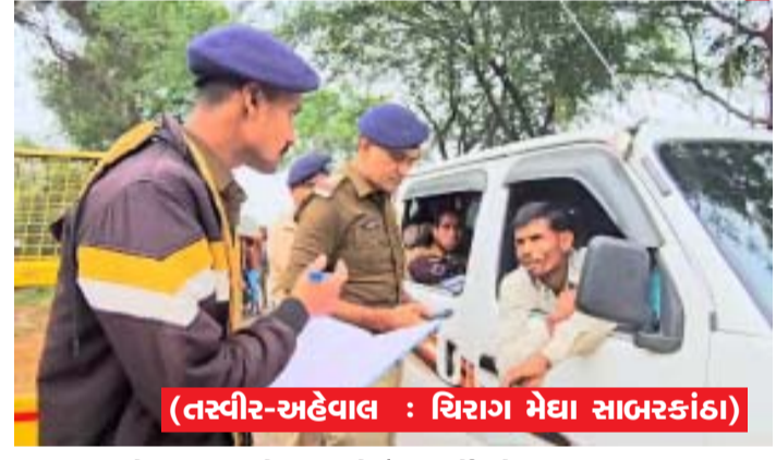
(તસ્વીર-અહેવાલ : ચિરાગ મેઘા સાબરકાંઠા)

(ગરવી તાકાત) સાબરકાંઠા તા.૨૭ ૩૧ ડિસેમ્બરના ગણતરીના દિવસો બાકી છે ત્યારે રાજસ્થાન ગુજરાતને જોડતી સાબરકાંઠા જિલ્લાની સરહદો પર સાબરકાંઠા પોલીસ વિભાગ દ્વારા સઘન ચેકીંગ હાથ ધરવામાં આવ્યું છે જિલ્લાની ગુજરાત રાજસ્થાનને જોડતી સરહદો જેમાં રાણી બોર્ડર, મામેર બોર્ડર, ખેડવા બોર્ડર, તેમજ કોટડા બોર્ડરો પર પોલીસ દ્વારા ચેકીંગ હાથ ધરવામાં આવ્યું છે.