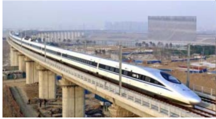
સુરત, તા. ૨૭ અમદાવાદ-મુંબઈ બુલેટ ટ્રેન પ્રોજેક્ટ ૧૦૩ કિલોમીટરના વાયડકટની બંને બાજુએ ૨,૦૬,૦૦૦ નોઈઝ બેરિયરની સ્થાપના કરી છે. દર ૧ કિલોમીટરના પટ્ટા માટે, વાયડકટની દરેક બાજુએ વ્યુહાત્મક રીતે ૨,૦૦૦ ધ્વનિ નિયંત્રકો મૂકવામાં આવ્યા છે, જેમાં અમદાવાદમાં ત્રણ ફેક્ટરીઓ અને સુરત, વડોદરા અને આણંદમાં એક-એક ફેક્ટરી આવેલી છે.

પ્રામ વિગતો અનુસાર, ધ્વનિ નિયંત્રકો ટ્રેન દ્વારા ઉત્પાદિત એરોડાયનેમીક અવાજ તેમજ ટ્રેક પર દોડતા પૈડાઓ દ્વારા ઉત્પન્ન થતા અવાજને પ્રતિબિંબિત કરે છે અને તેનું વિતરણ કરે છે. દરેક અવરોધની ઉંચાઈ ૨ મીટર અને પહોળાઈ ૧ મીટર હોય છે, જેનું વજન આશરે ૮૩૦-૮૪૦ કીગ્રા હોય છે.