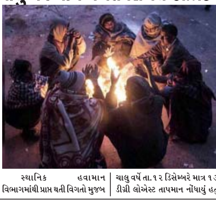
સ્થાનિક હવામાન ચાલુ વર્ષે તા. ૧૨ ડિસેમ્બરે માત્ર ૧૩ ડીગ્રી લોએસ્ટ તાપમાન નોંધાયું હતું

(ગરવી તાકાત) અમદાવાદ તા.૨૦ ગ્લોબલ વોર્મિંગની અસર હેઠળ સર્વત્ર હવામાનમાં સતત ફેરફાર જોવા મળી રહ્યો છે. જ્યાં ભારે માસ ગરમી હોય ત્યાં ભારે વરસાદ અને વરસાદ હોય ત્યાં ધ્રુવ દુષ્કાળ જેવી સ્થિતિ સર્જવા લાગી છે. રાજકોટની જ વાત કરીએ તો રાજકોટ શહેરમાં ગત વર્ષે ડિસેમ્બર માસ માત્ર 'હુંફાળો' રહ્યો હતો. તેની સામે ચાલુ વર્ષે ચાલી રહેલા ડિસેમ્બર માસ દરમિયાન આજ સુધીમાં રાજકોટ શહેરમાં સિંગલ ડીગ્રીટમાં પાંચ વખત તાપમાન નોંધાયું છે. આથી કડકડતી ઠંડીનો અનુભવ થઈ રહ્યો છે.